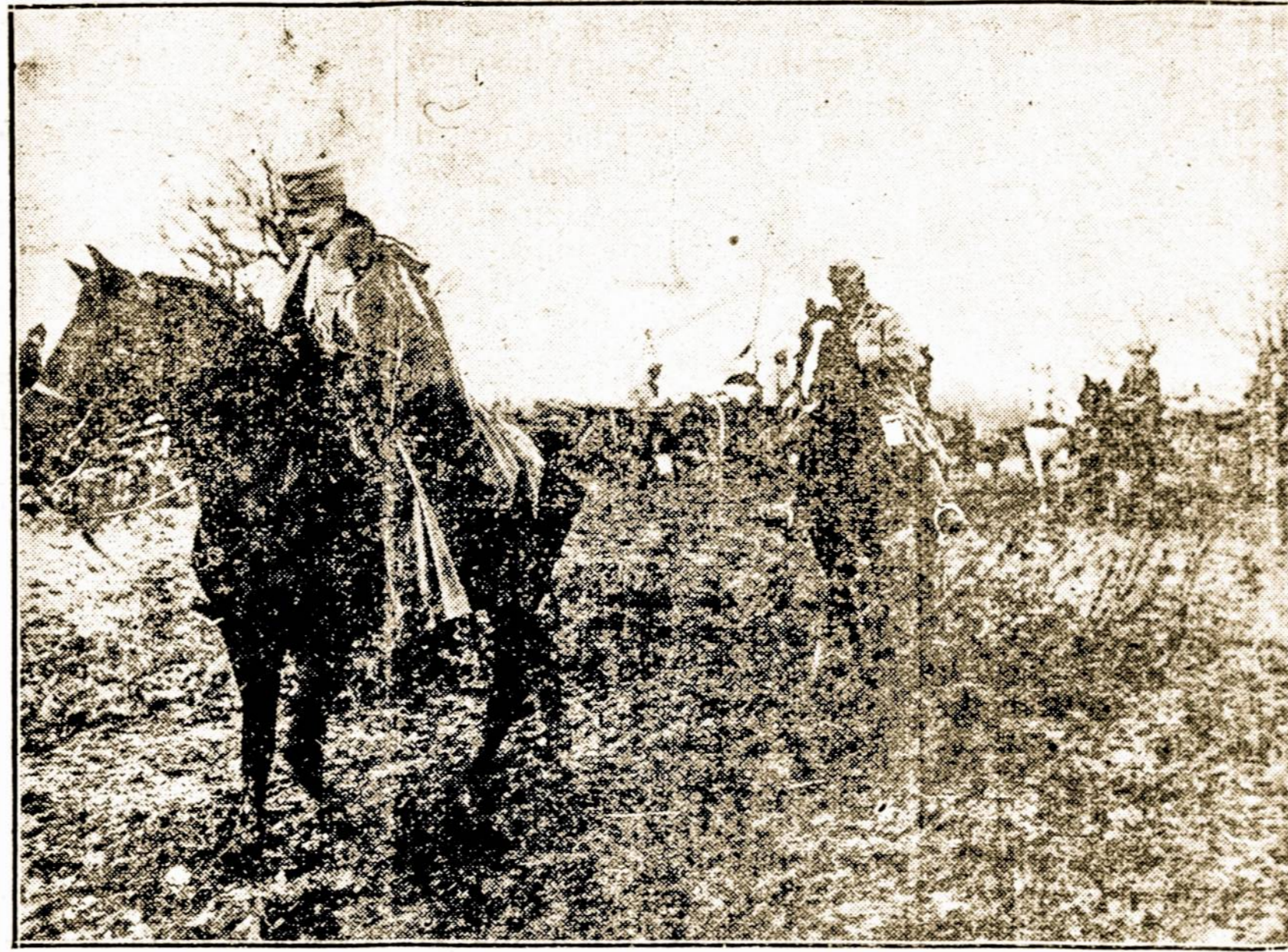
Austrų raiteliai, lydintįs transportus per Galiciją.