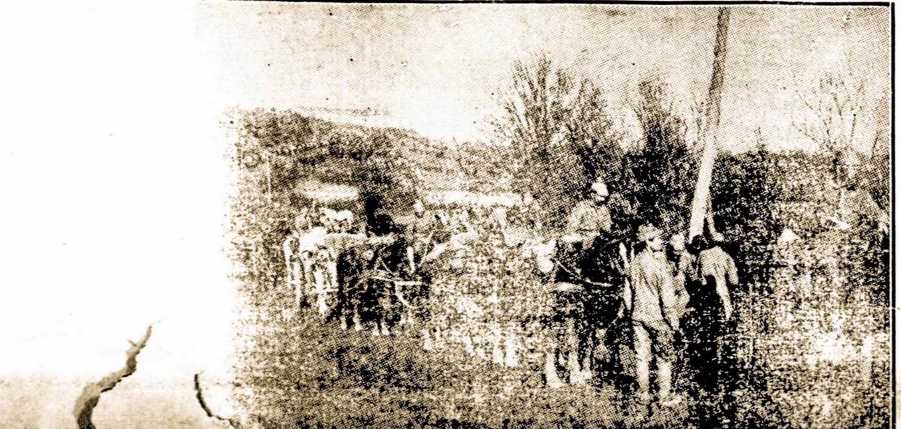
Vok. transportai begaline eile traukia per Lietuvos laukus į Dinaburkio ir Rėfos frontą

Su visokiais reikalais kas link "NAUJIENŲ" cirkuliacijos melėdizime kreipties prie viršminėtu distriktų užveidų arba "Naujienu" Ofisą.