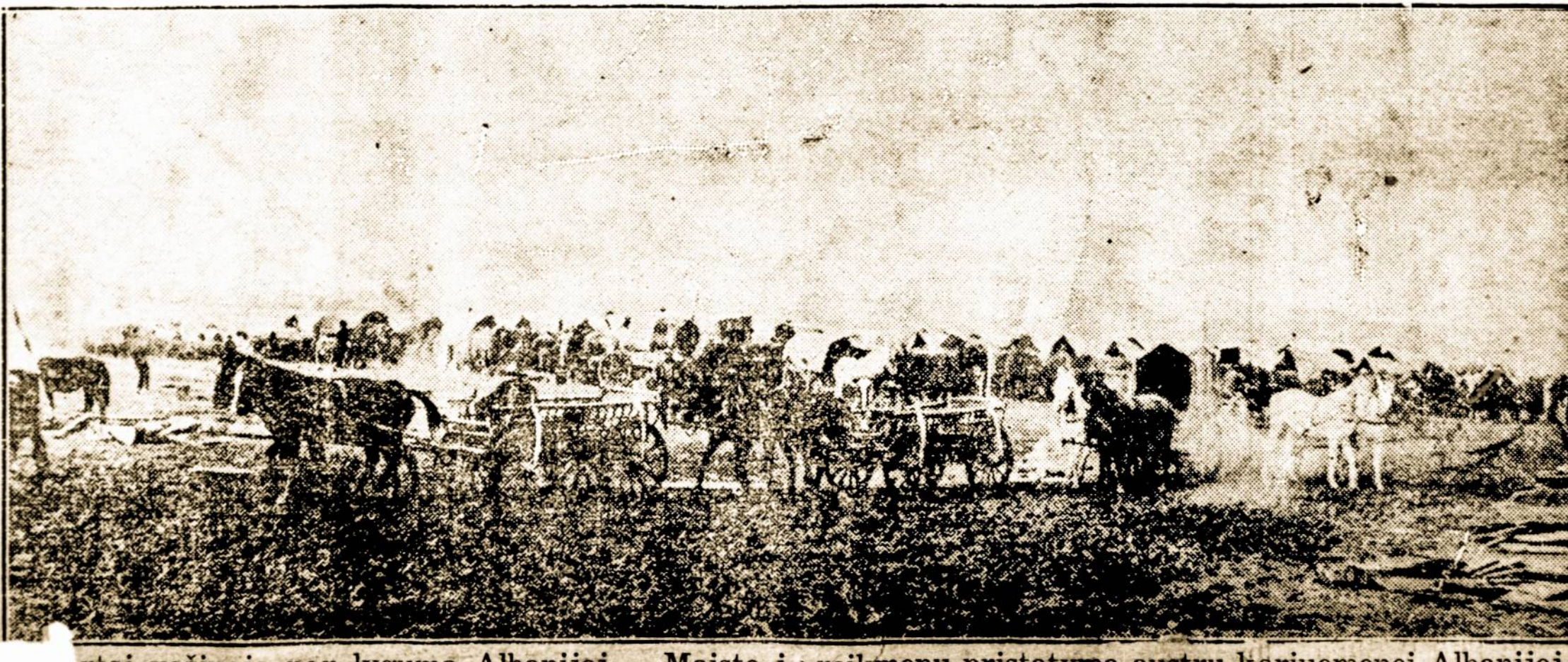
Tai važiuoja per lygumą Albanijoj. Maisto ir reikmenų pristatymą austru kariuomenėi Albanijoj apsunčia stoka geležinkelio ir netikė Serbijos ir Albanijos keliai.

VILNIUS, — Vilniuje ketina plačiai išsiskleisti pašalpos suteikimas. Tveriaman tan komi-tetan prigulės valdžios atstovų ir asmenų iš visų gyventojų sluog-snių. Labiausia turima akyje liaudies virtuvės, kurios labiausiai rupinasi maitinimu čionykščių beturčių gyventojų.