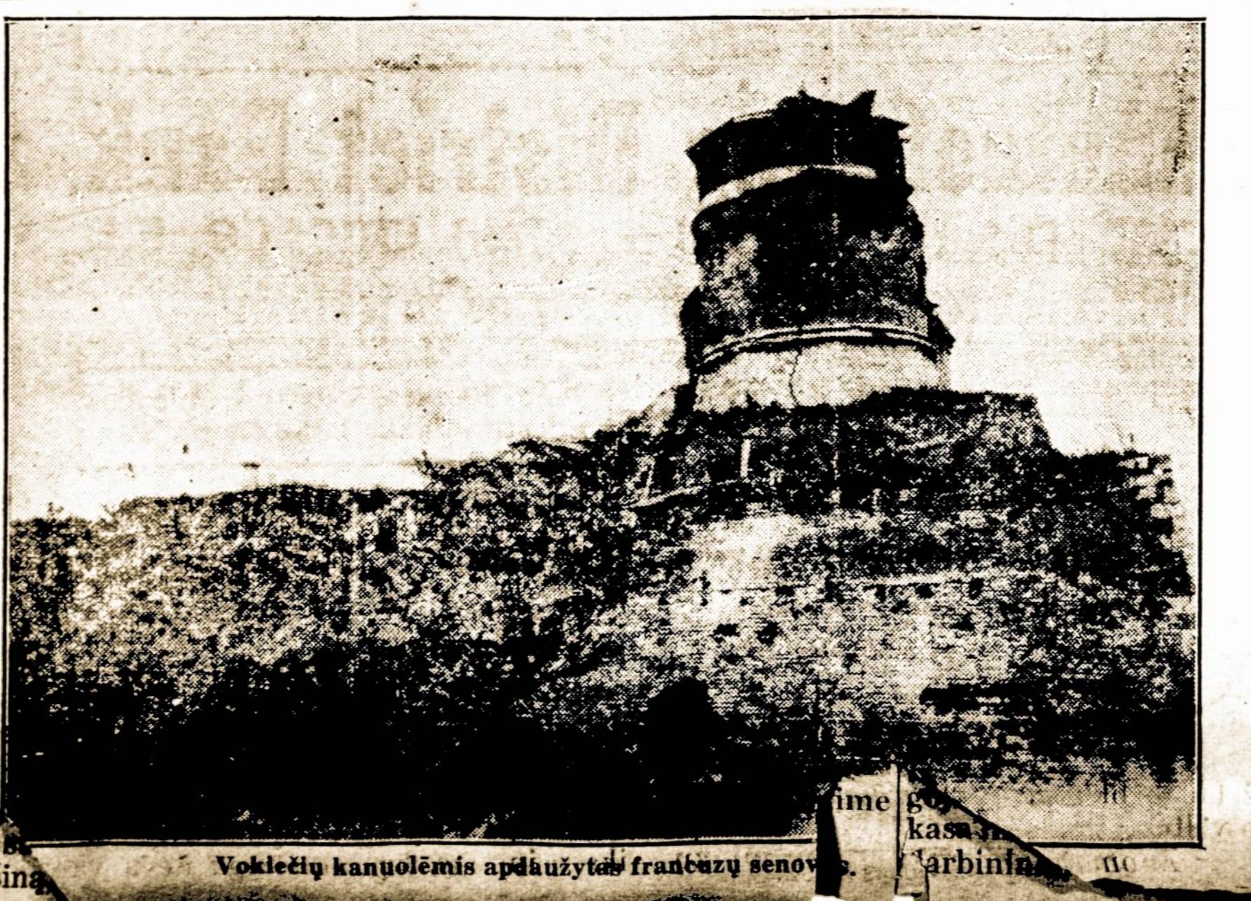
Vokietų kanuolėmis apdauzytas franctų senov...

Pasistengkit delto „padaryti interkmo... į SLA. ir TMD., kad šios duotų reikalingus igalio-