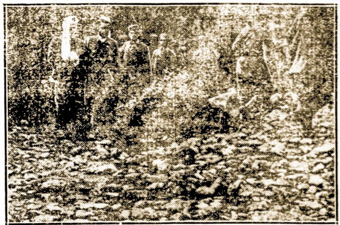
Burelis Cernogorijos kareivių.