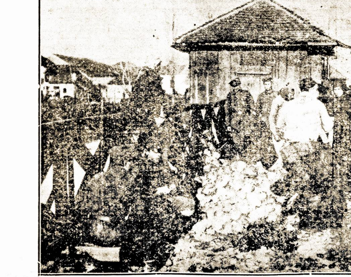
Serbų kaimiečiai po priežiura vokiečių, nudirbę laukus, sunėša daržoves į tam-tikrą vietą ir atiduoda savo paskutinį maistą vokiečiams.