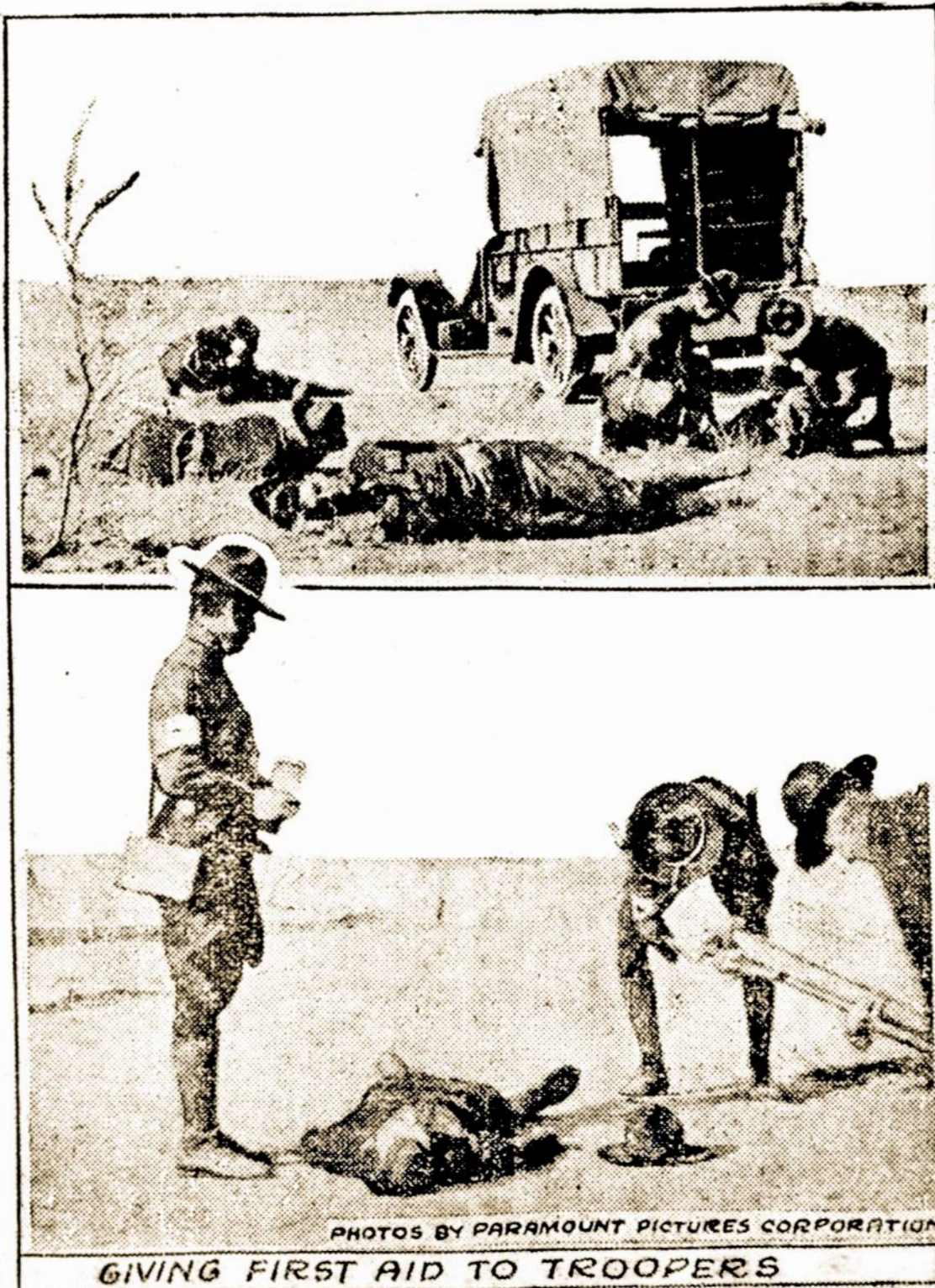
Suteikimas pirmos pagalbos sužeistiems kareiviams.

BERLINAS, geg. 4. — Socialistai inėšė į reichstagą rezoliuciją, reikalaujančią kad kancelaris von Bethmann-Hollweg tuojaus paliuosuotų Liebknechtą ir panaikintų prieš jį apkaltinimus.