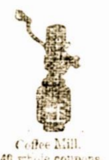
Coffee Mill 140 whole coupons.