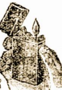
Hawkeye Automatic Lighter 75 whole coupons.