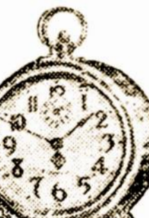
Are Eight-day Alarm Clock 275 whole coupons.