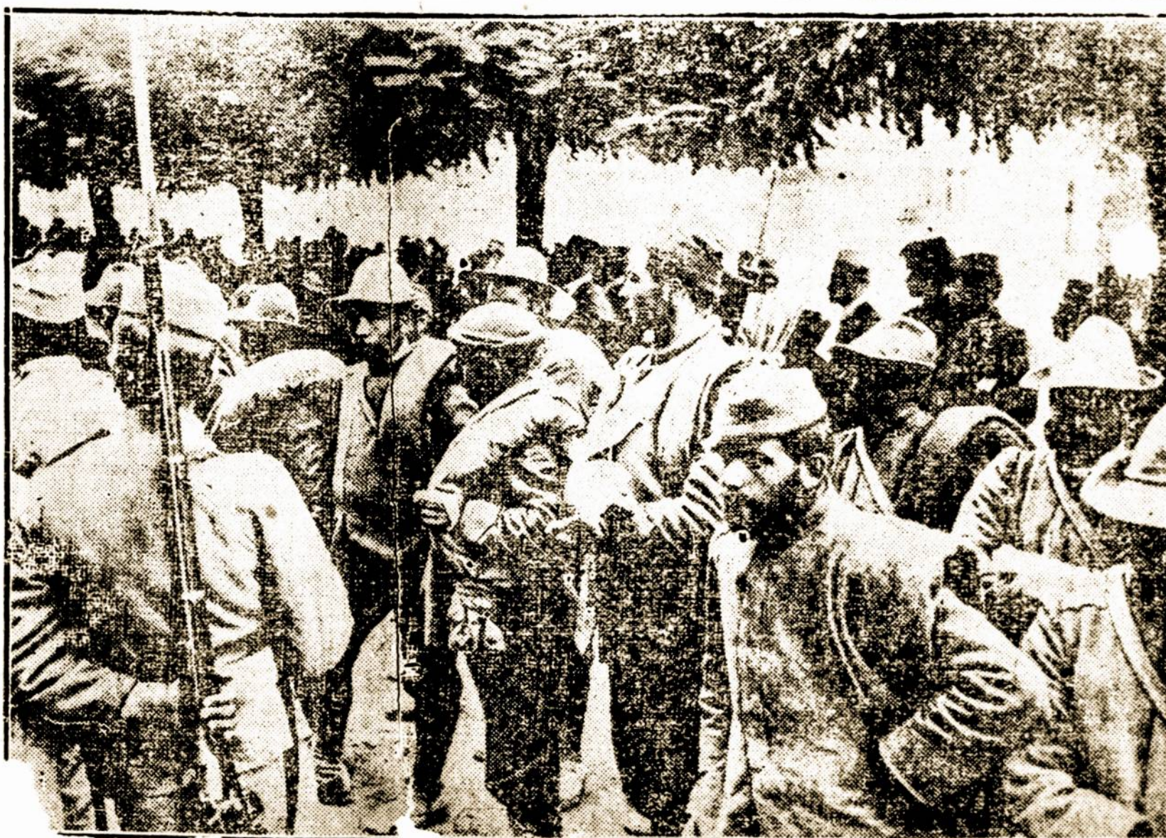
Italijos kareiviai atgabenti vienon imtinių stovyklon.

Ta komisija banadė kontroliuoti gatvekarius Chicagoje, bet miestas tam pasipriešino, užvedė bylą, kurią ir laimėjo. Komisija ketina apeliuoti į augštesnį teismą.