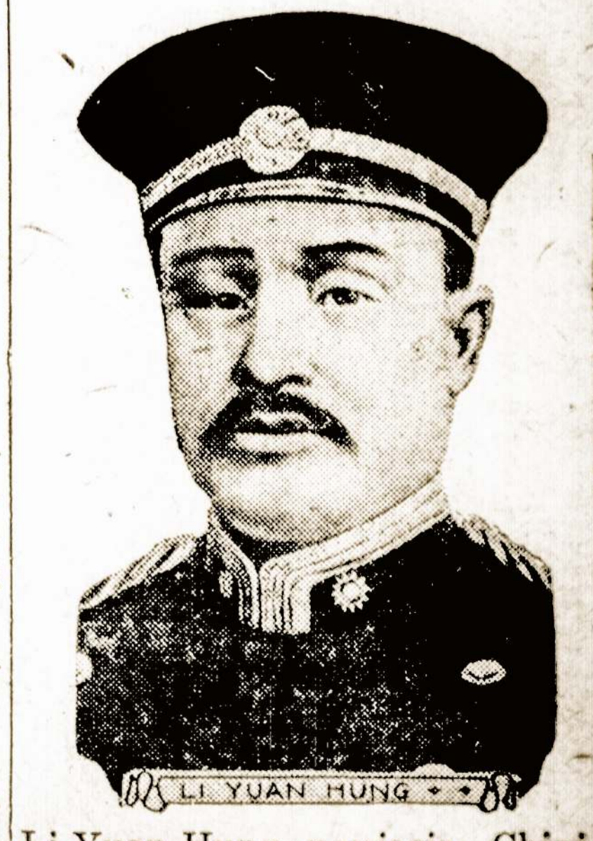
Li-Yuan-Hung, naujasis Chinijos prezidentas. Jisai plenuoja panaikinti cenzurą Chinijoj.