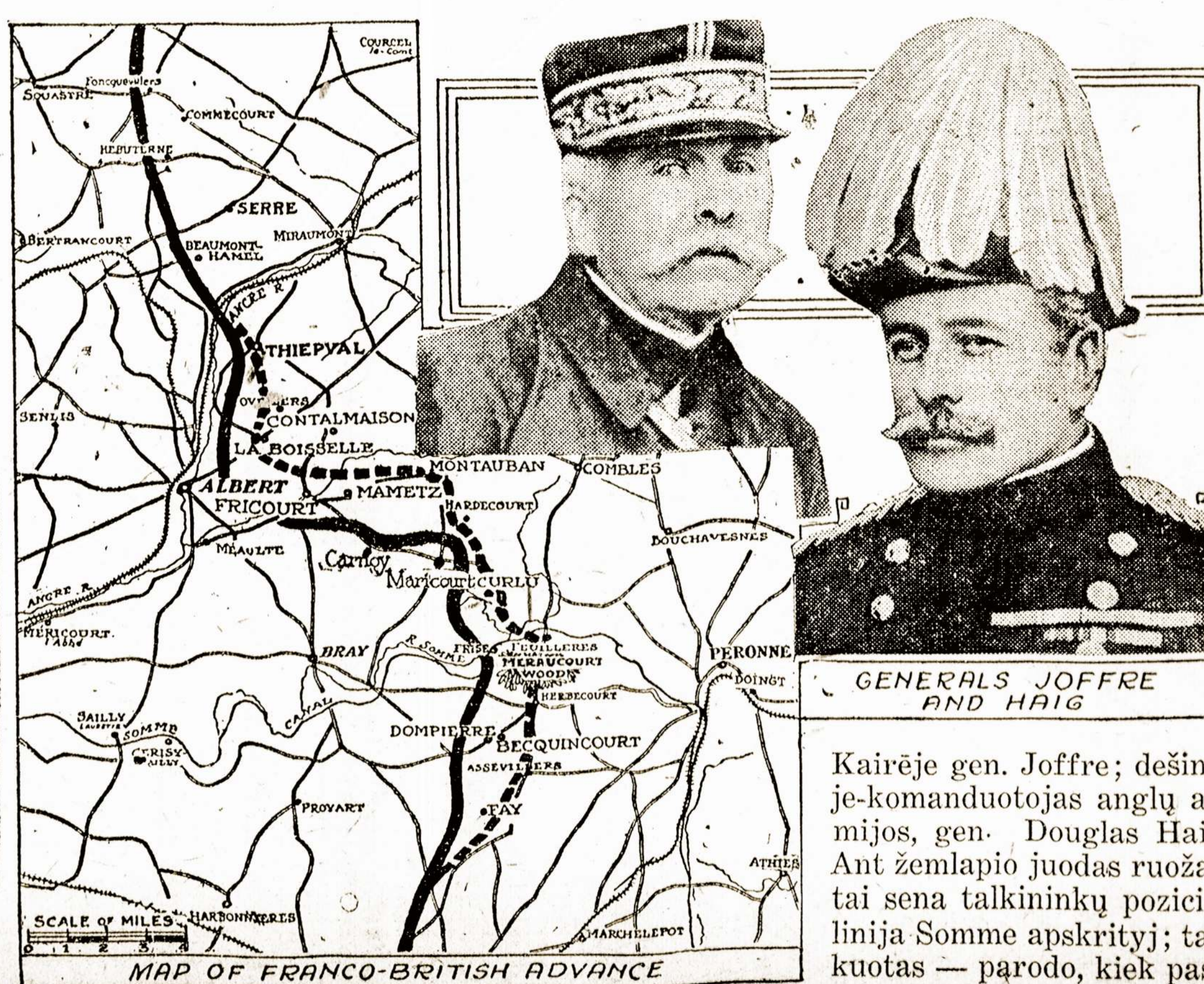
GENERALS JOFFE AND HAIG

WASHINGTONAS, liepos 17. — Plenuojama intaisyti 500,000 dol. paraku fabriką ir $20,000,000 vertės azotinės rukšties fabriką, taipjuu kariškiems reikalams, manoma intaisyti kur nors šalies gilumoje, kad nelengva būtų pasiekti dėtoje priešams.