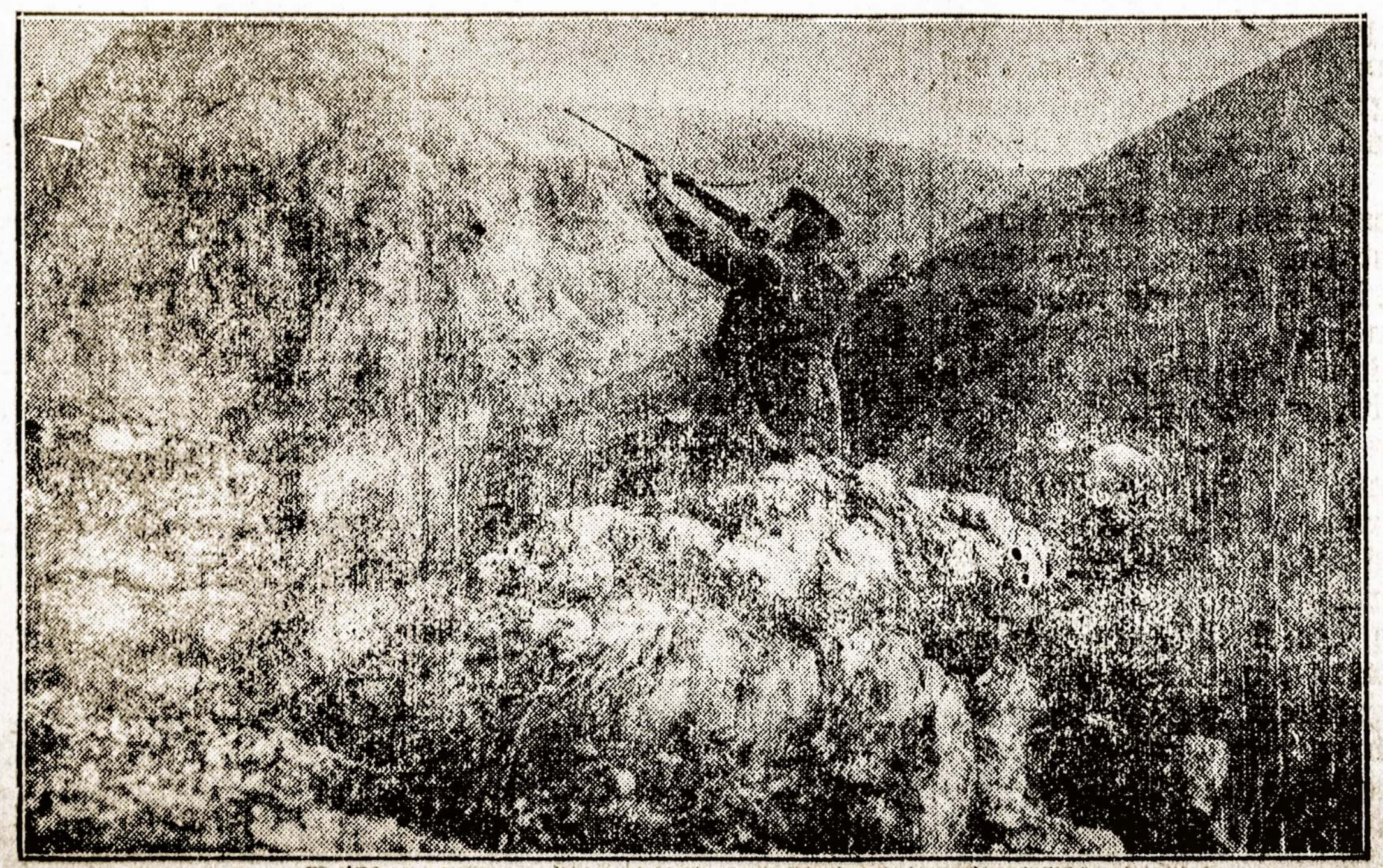
Vokiečių oficerai medžioja erelius Makedonijos kalnuose.

"NAUJIENOS" 1840 So. HALSTED ST., CHICAGO, ILL.