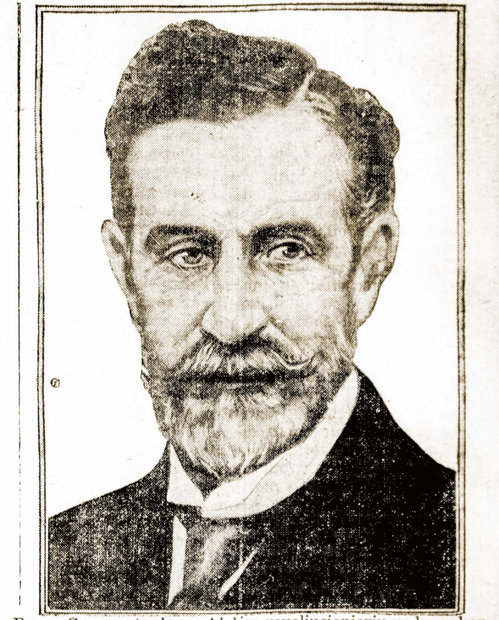
Sir Roger Casement, vienas Airijos revoliucionierių vadų, pakar- tas ketverge, rugpjūčio 3 dieną, 9:09 valandą ryte, Pentonville kalėjime (Anglijoje).

jos socialistais — J. Guesde, A. Sembat ir A. Thomas, kurie karės laiku priėmė ministerių vietas, "nes to norėjo didžiama Francijos Socialistų Partijos." Ir sako: