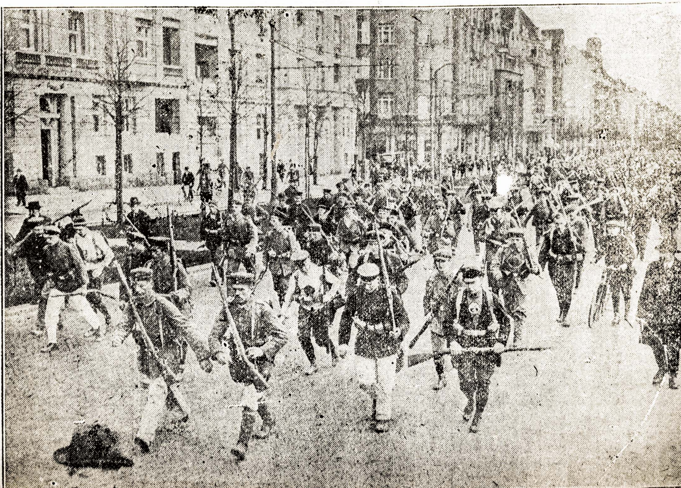
Kareiviai, genami į tranšejas kitų žudyti ir patiems žuti. Nedaug jų gyvų išliks.

Kampus La Salle ir Washington Sts. prieš City Hall.