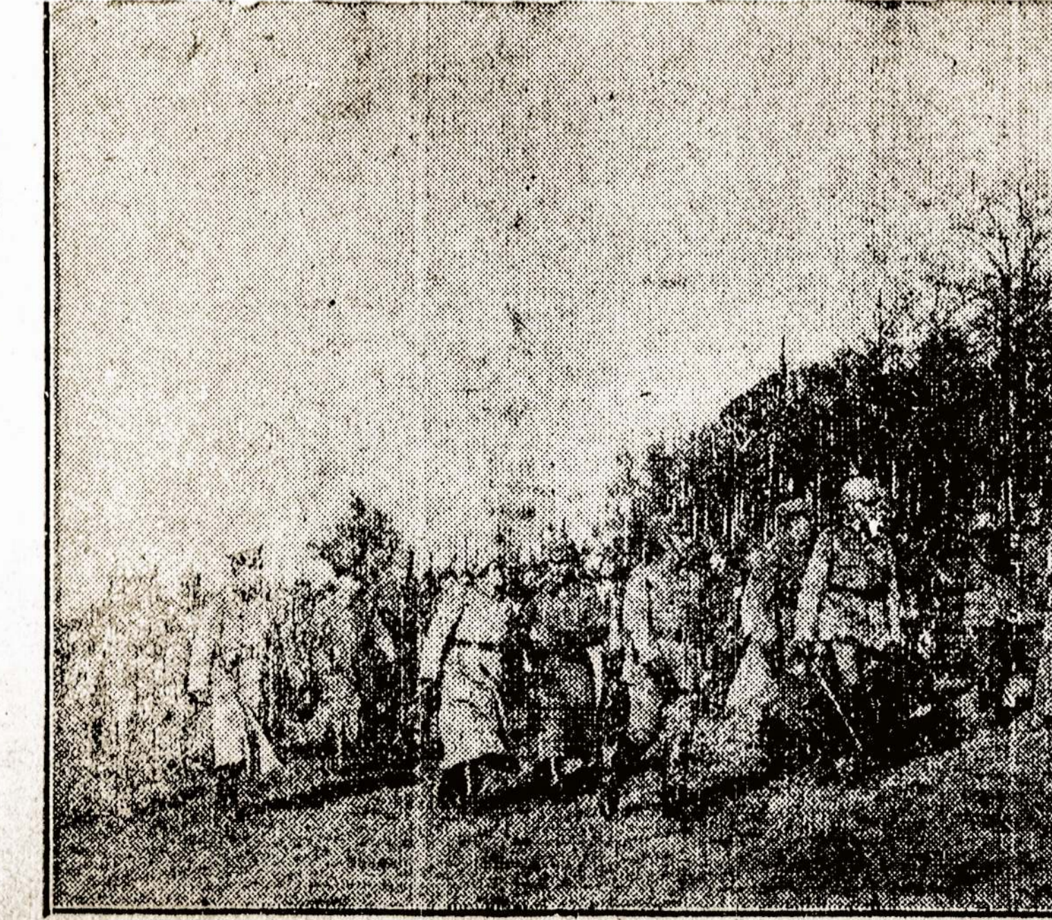
Vokiečių kaizeris daro savo kariuomenės apžvalgą.

Valstybinių taksų nuo savo turtu, nešančių $69,499,732, J. Pierpont Morganui reikės išmokėti $2,587, 675.