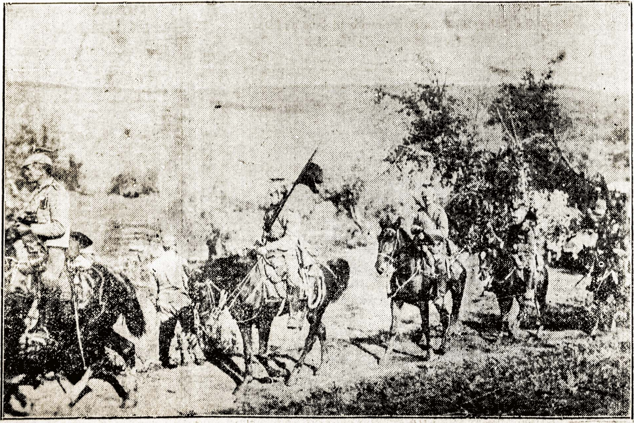
Lenkų legionų raiteliai austrų armijoje. Jie pasižymėjo savo narsumu mušiuose su rusais.

"NAUJIENOS" 1840 So. Halsted St., Chicago, Ill. Telephone Canal 1806 Cable, Naujienos - Chicago