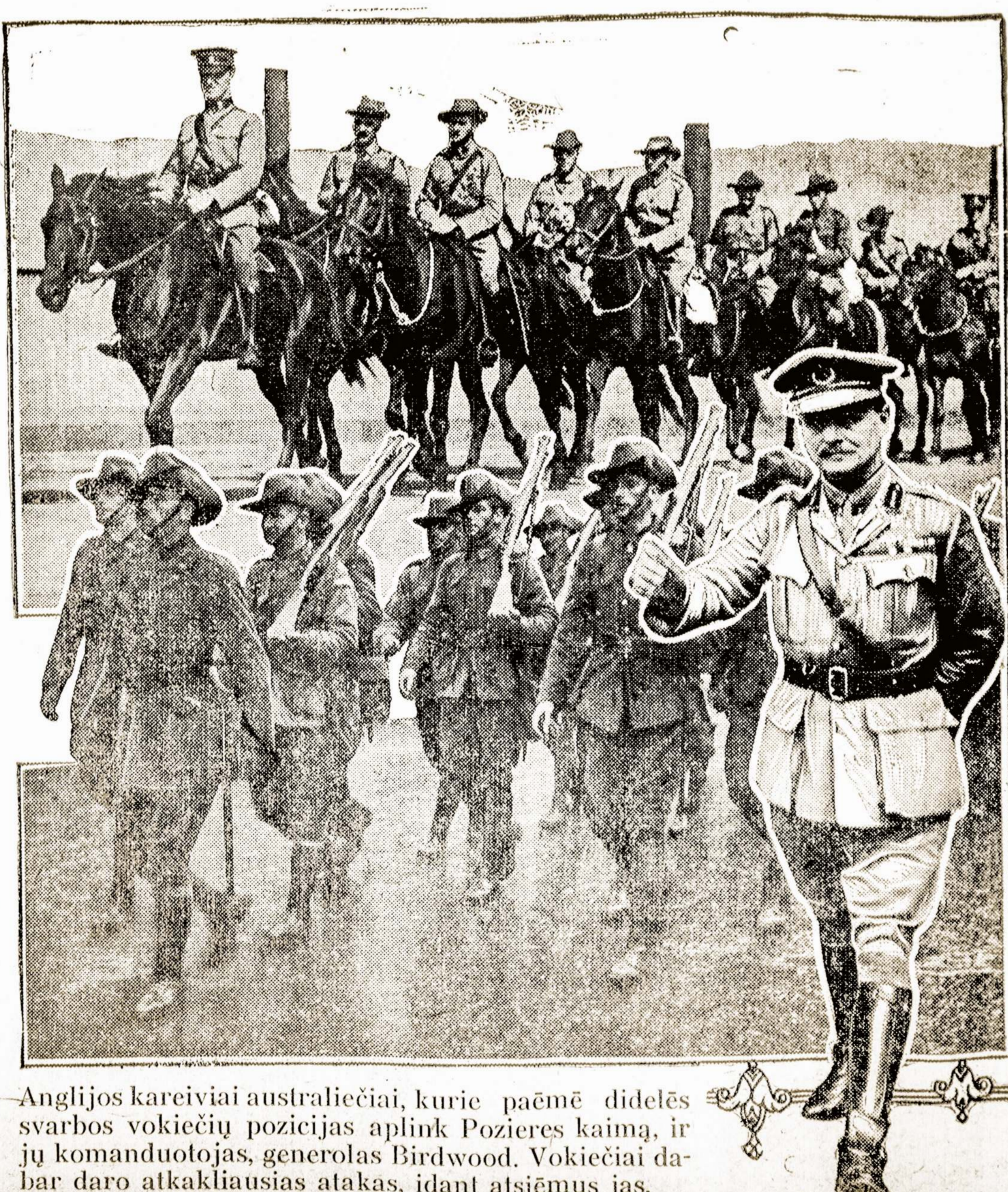
Anglijos kareiviai australiečiai, kurie paėmė didelės svarbos vokiečių pozicijas aplink Pozieres kaimą, ir jų komanduojuojas, generolas Birdwood. Vokiečiai da- bar daro atkakliausias atakas, idant atsiėmus jas.

Anglijoje geležies išdirbystė- je dirba 23,000 moterų.