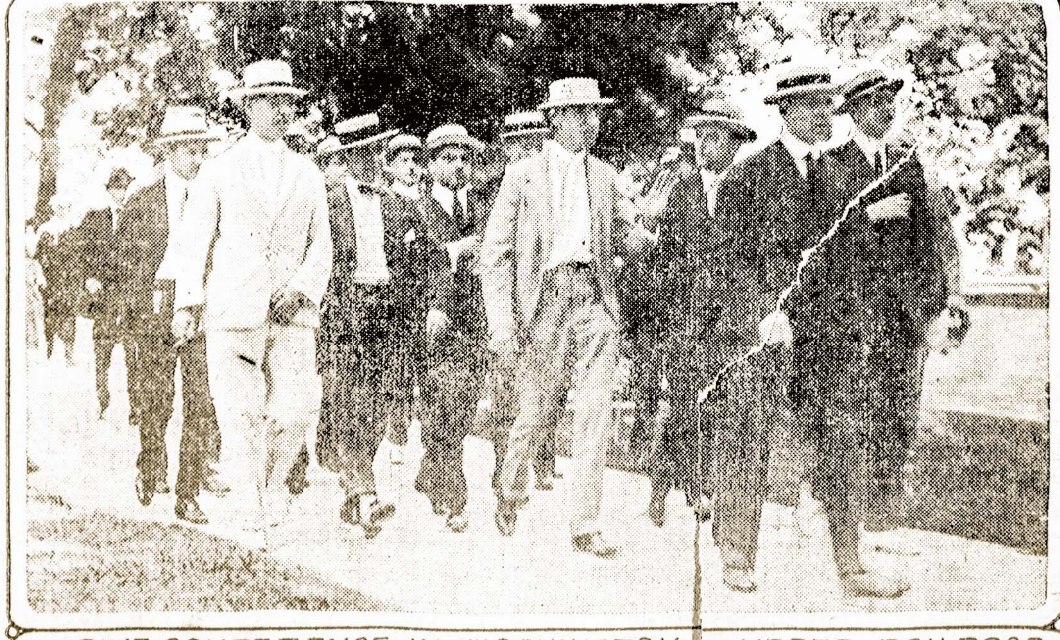
STRIKE CONFERENCE IN WASHINGTON — UPPER RAILROAD REPRESENTATIVES — LOWER, UNION LEADERS