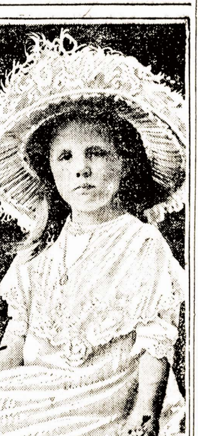
Vienatinė Hollandijos karalienė Vilhelmos duktė, kunigaikštystė Juliana, šiuo laiku sunkiai serga. Jei ji mirtų, tai Hollandijos sostas tektų Vokietijos kunigaikščių. Mergaitė dar tik septintus metus eina.