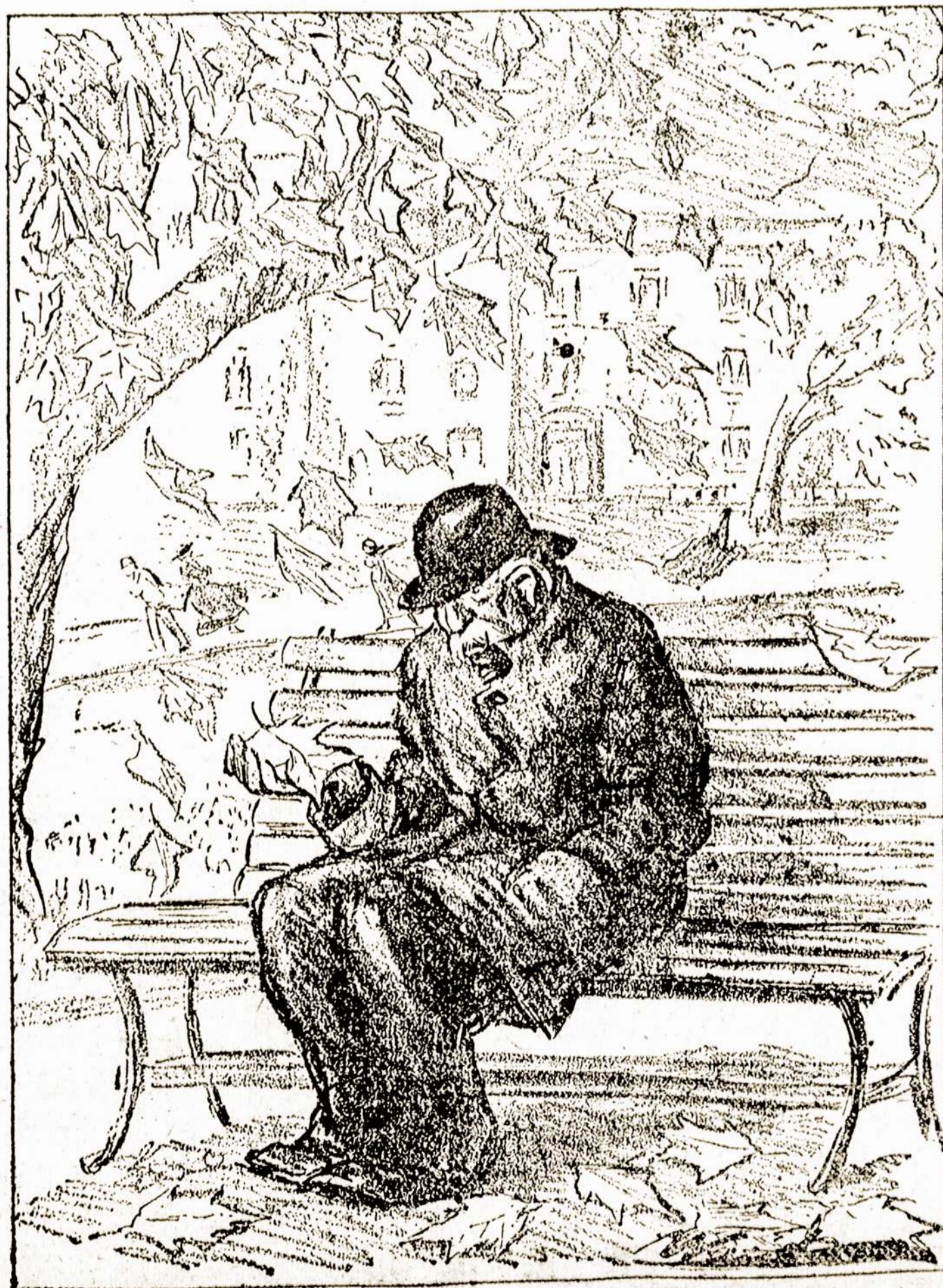
—Weed in Philadelphia Ledger. Ziemos pranašas pavargėliui

St. Paul spalijų mėn. 1915 m. — 271 vest.; 1916 m. — 334 vestuvės.