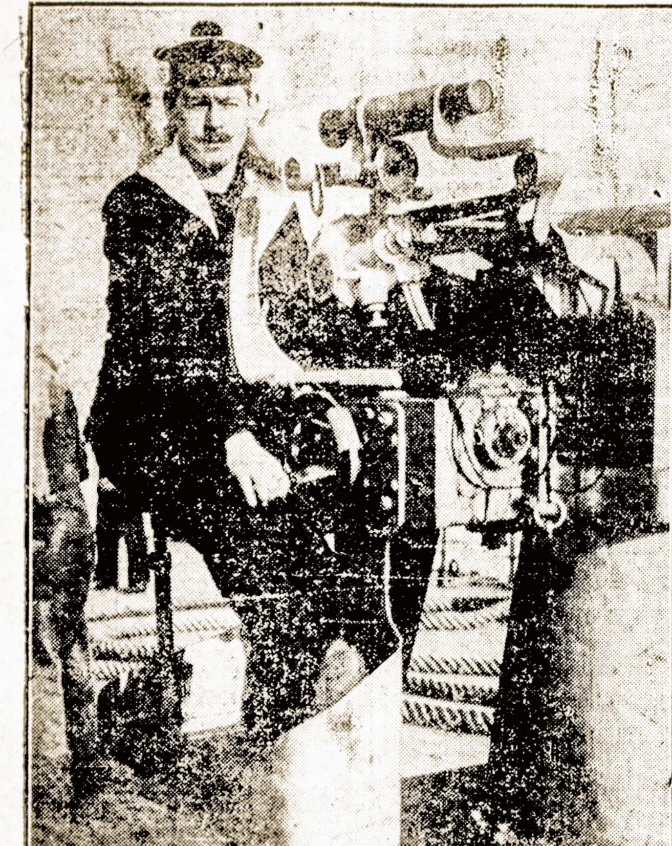
Laivo "La Touraine" šešiacis olis kulkosvaidis povandeniniam laivams šaudyti.

Skaitykite ir platinkite vienintėl Rusuose lietuvių darbo žmonių laikraštį