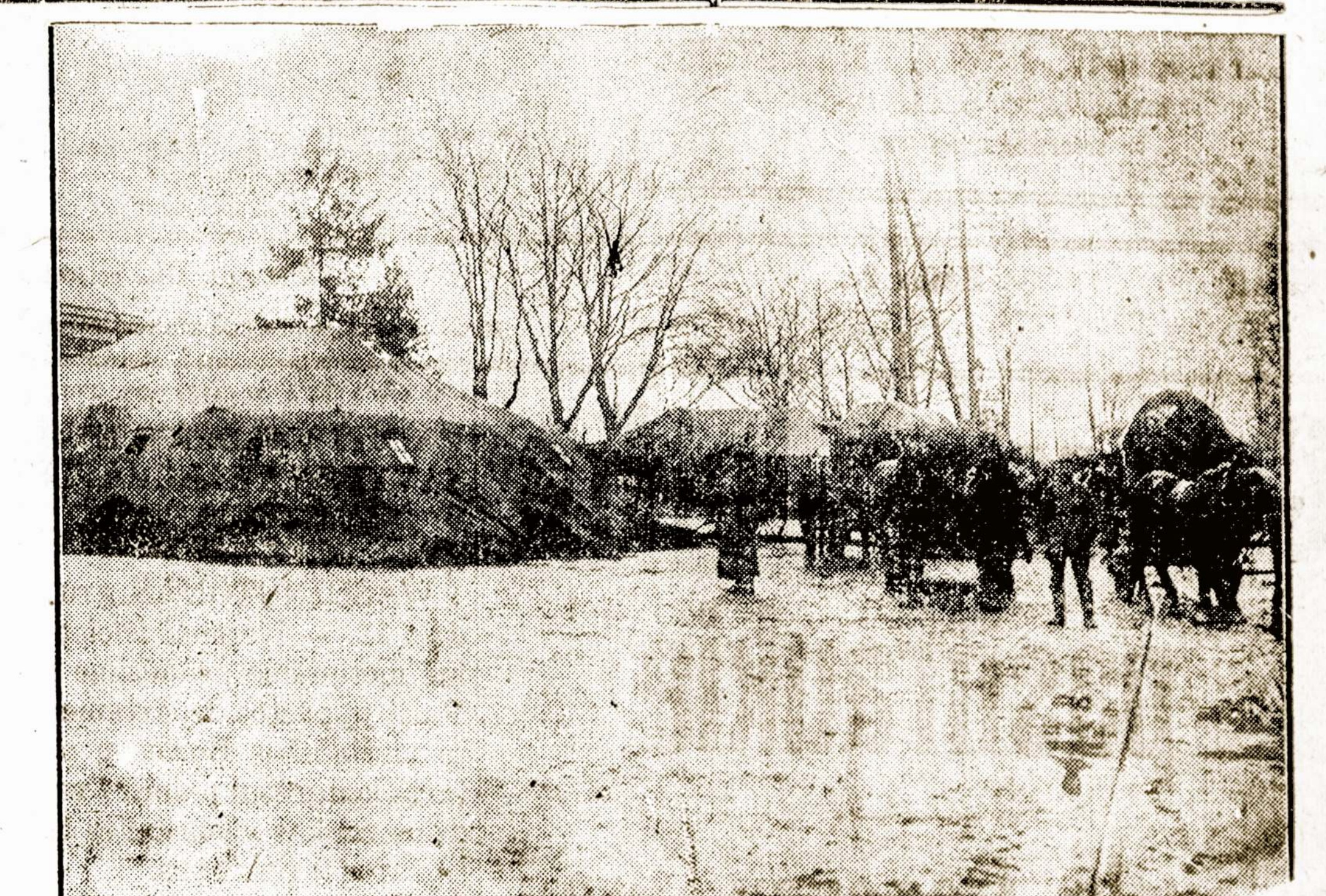
Etapo stotis vakarų fronte.