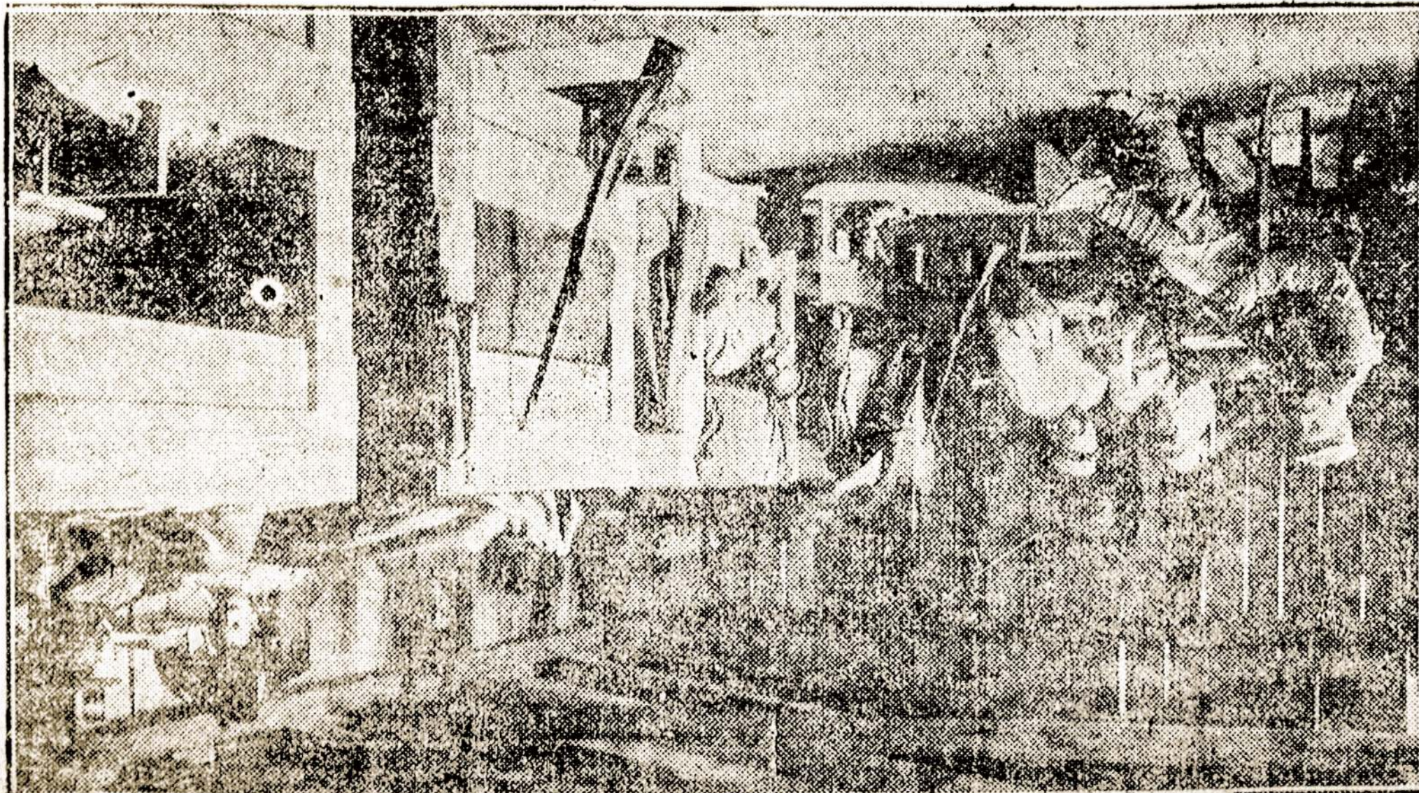
Nuo bombų apsaugotoj pož eminęj kameroj.

ATHENAI, gruodžio 12. — Graikų valdžia išleido fo-rmalj protestą prieš talkini-nkų blokadą, paskelbtą Gra-ikijai.