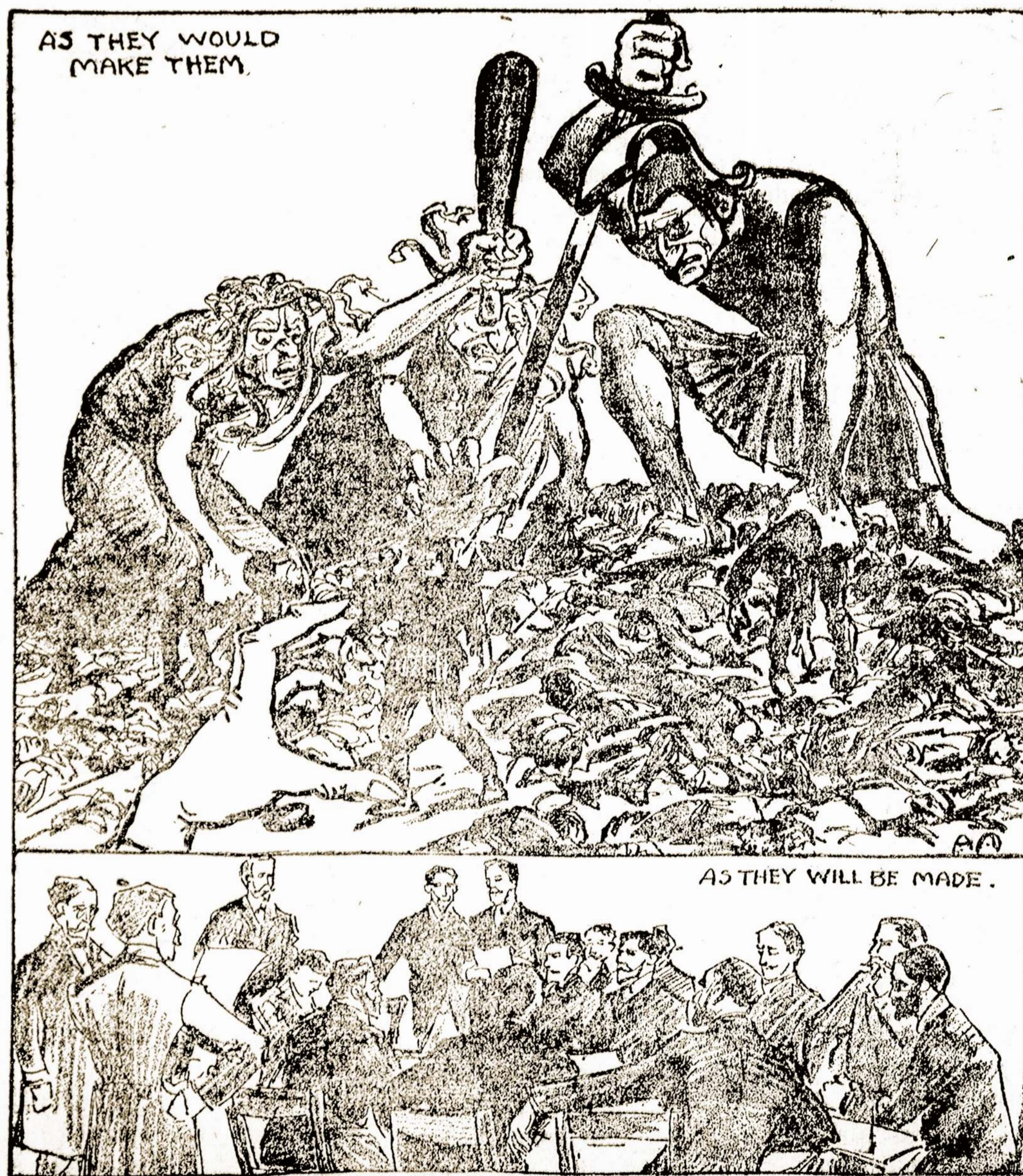
Taikios salygos: Kokių kiekvienas jų nortėtų (viršutiniame paveikslyj) ir kokios jos bus (apatiniame).