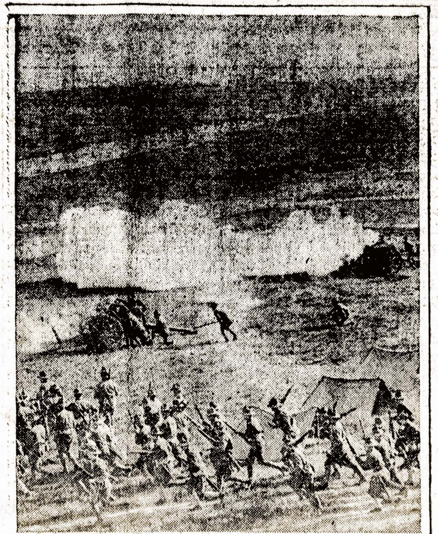
Suv. Valstijų kariuomenės stovykla; prirengia kareivius siuntimui į Francijos frontą.

PETROGRADAS, rugp. 31. — Nežinomi blogdariai vakar padegė didelę amunicijos dirbtuvę Ochtėje, netoli Petrogrado. Kilus eksplozijai daug darbininkų tapo užmušta ir sužeista. Materialių nuostolių gaisras pridarė už kelis mil. rublių. Blogdariai nepagauta.