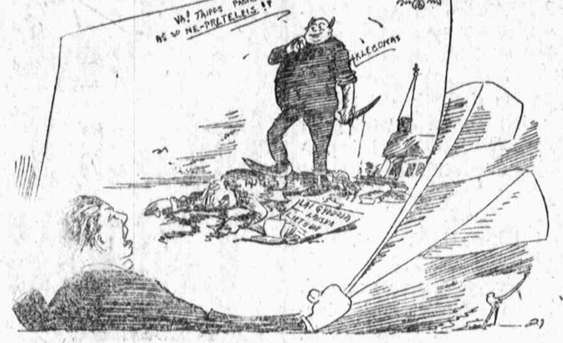
ir jų darbai