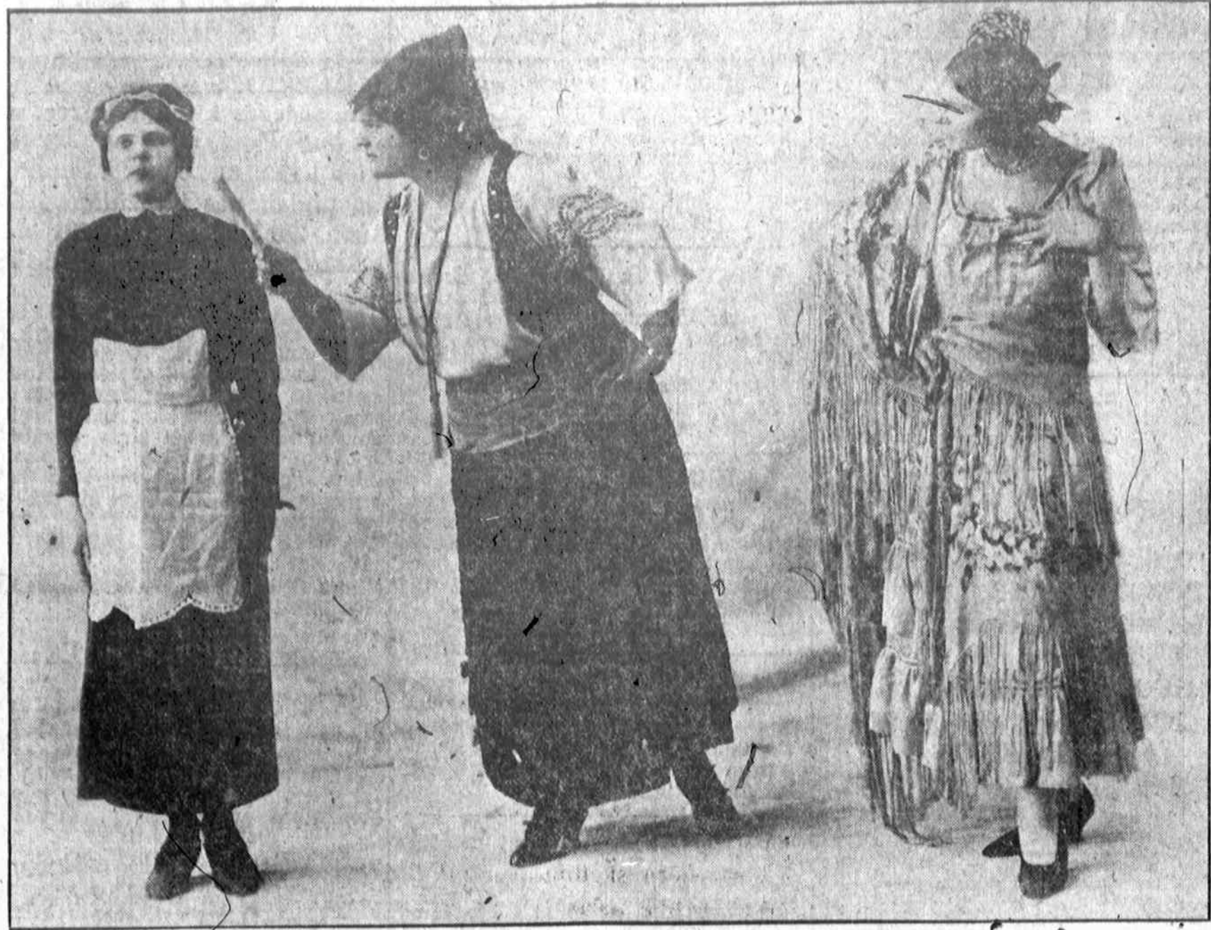
SCENA IS OPERETES "BAILUS DAKTARAS".

Sekmadienį balandžio 29 d. Arroyo Grotto Theatre 7 ir Wabash Ave. visi galės pamatyti tą bailų daktarą ir bailų meilumą. —Raganius.