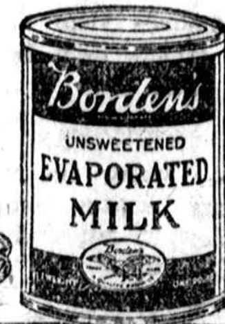
Didelis Kenas 16 unc.

Didelis kenas BORDEN'S EVAPORATED PIENO su lygia dalimi vandens suteiks jums 4 puodukus gryno pilno smetonos pieno