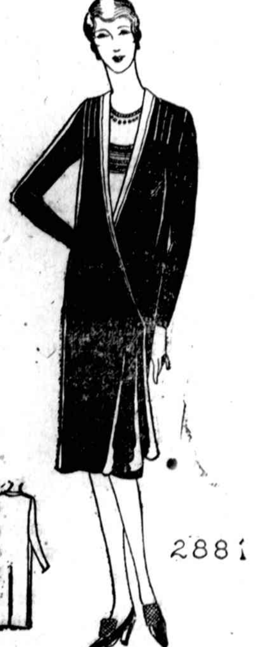
2881. Labai elegantiška iš aksominės materijos pasiuta suknelė. Galima apsiuti su aukso arba sidabru kaip dabar tai daroma.

Sukriptos mieros 16 metų, 18 metų, 36, 38, 40, 42 ir 44 colių per krutinę. 36 mierai reikia 3¼ yardų 40 colių materijos ir ¾ yardų skirtingos materijos apsiuvėjimui. Norint gauti vieną ar daugiau virš nurodytų pavyzdžių, prašome iškripti paduota blanket arba priduoti pavyzdžio numerį, pažymėti mierą ir aiškiai parašyti savo vardą, pavardę ir adresą. Kiekviena pavyzdžio kaina 15 centų. Galima priųsti pinigų arba krasos ženkleliais kartu su užsakymu. Laiškus reikia adresuoti: