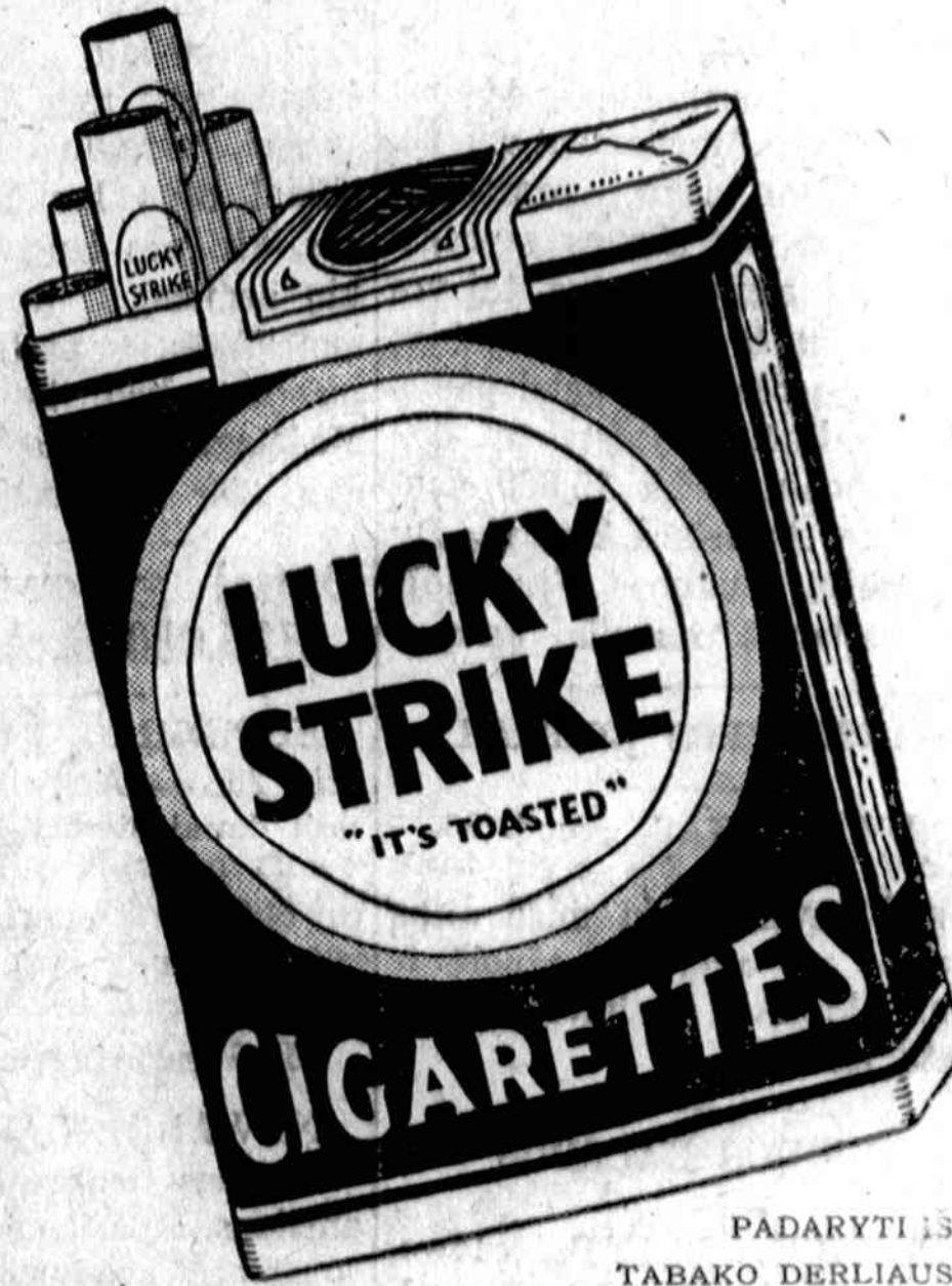
PADARYTI IŠ TABAKO DERLIAUS SMETONOS

Jūs taipgi atrasite, kad LUCKY STRIKES suteikia didžiausio smagumo — Švelnūs ir Malonūs, puikiai cigaretai, kokius tik kada esate rūkę. Padaryti iš parinktinausių rūšių tabako, tinkamai išsistovėjusio ir labai gambiai sumaišyto; o apartyto, yra dar ir specialis procesas—"IT'S TOASTED"—ir nei jokio šiurkštumo, nei mažiausio kirpimo lūpų bei liežuvio.