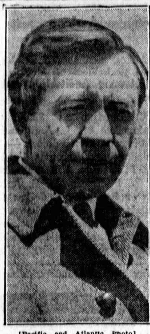
Polimosios šiaurės tyrinėtojas Vilhelmur Stefansson.