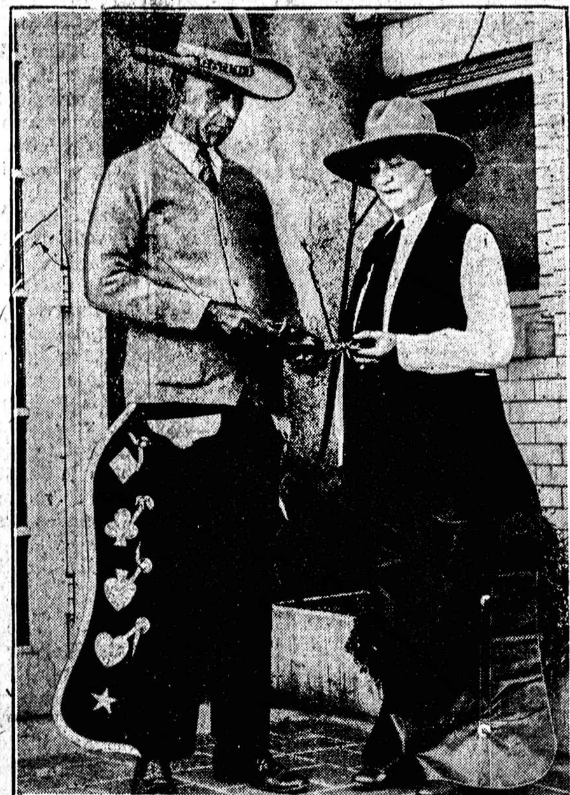
Nieko nepaprasto, išskiriant drabužius. Paveiksle senatorius Reed Smoot su savo paties pačia, abudu apsirengę Wyoming valstijos fermerių kostiumais

Maskva, Rusija, rugs. 10. Kuomet sovietų malkomis užverčiama kitų šalių rinkai pusdykiai, tai pačioje Maskvoje ligi šiol tik 17 nuosimčių malkų teigauta, o jau žiema ten greit artinasi.