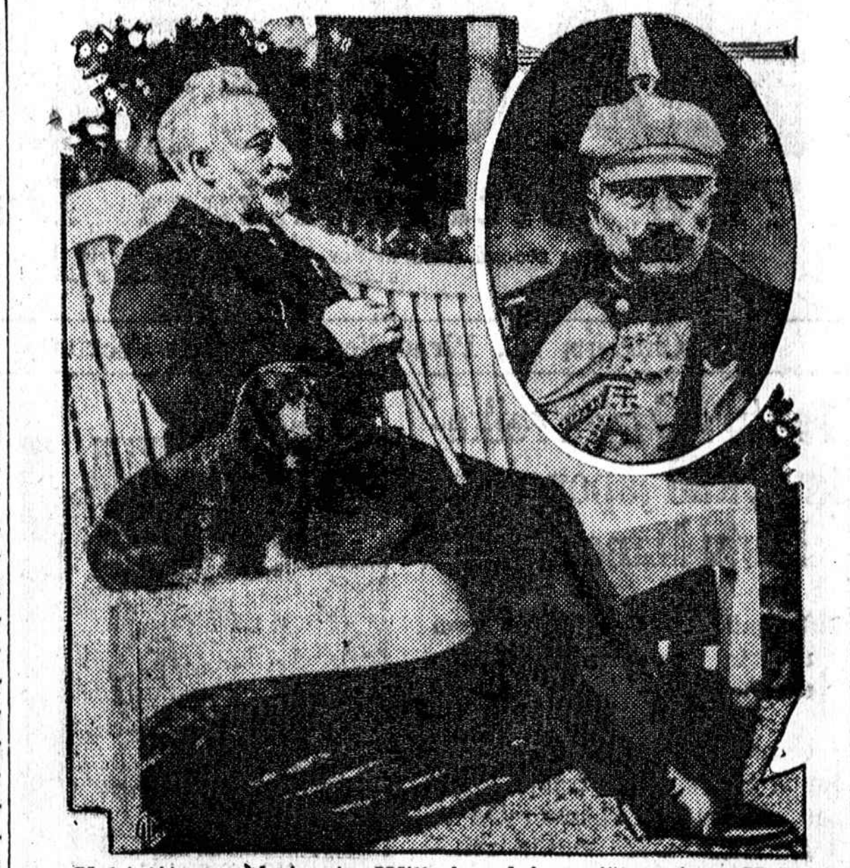
Vokietijos ex-kaizeris Wilhelm dabar, išstremime Holandijoje ir tada, kai jis buvo visagalinčiu Vokietijos kaizeriu. Hitlerininkams ir nacionalistams įsigalėjus Vokietijoje, jis jau rengiasi grįžti Vokietijon, kad užimti sostą. Pasak jo adjutanto, jis kaip Vokietijon negrįšias, kaip tik pilnu valdonu — kaizeriu.

Paš mane kilo klausimas: kam reikalinga yra ta aukšta geležinė tvora, kuri, nusidriekusi taip toli per kapines? Ką gi ji čia skiria? Ar tuos kryžius nuo akmenų, ar akmenis nuo kryžių? Ta aukšta geležinė tvora negali skirti tų mirusių kunų, kurie yra giliai žemėje įkastai, dėl to kad per-