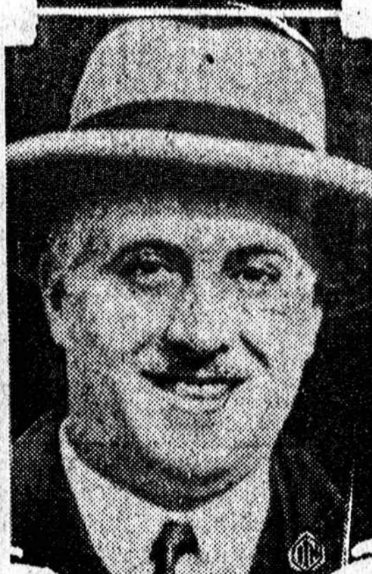
Naujasis Francijos premieras Edouard Daladier, kurio iš radikalų sudarytas kabinetas pasilaiko tik dėka socialistų parama.

Pas mus blogi laikai labai jaučiami. Kur tik nepasiseks, visur daugybė tuščių krautuvinių nuomai. Ir išnuomuoti jas galima labai pigiai, bet niekas jų nenori, kadangi jokio biz-