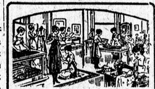
DABAR yra laikas paravoti apie juos daktarui atoti. Ką ji veiks kaip užbaigė mokyklą? Štai yra geras del jos progą išmokyti dresų dezalinimo, dresų siuvimo ir skrybių dirbimo ir uždarbui pinigų po užbaigimo kurso. Mes išmokinsime ją labai trumpa laiku. Rašykite del dykai informacijų ir kungybei L. kuri išaikius apie mūsų mokyklą. MASTER SCHOOL OF DRESS DESIGNING, DRESS MAKING & MILLINERY (J. KASNICKA, Vedėjas) 389 S. Wabash Ave. Tel. Wabash 0075

Pas mus nemažai jaunuolių baigė aukštesnes mokyklas ir gavo diplomus. Dabar jie tais popierio gabalais ir tegali pasidžiaugti. Kokį nors darba