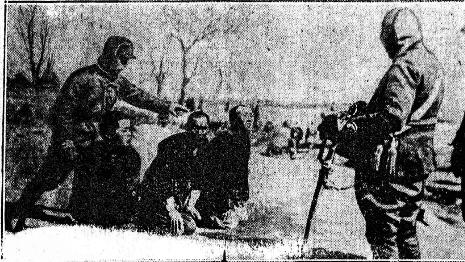
Ekzekucija trijų chiniečių partizanų, kuriuos japonai pagavo kovojant Jehol fronte. Dešinėj stovi budelis su dideliu kardu, prisiruošęs nukapati sukluptytiems chiniečiams galvas