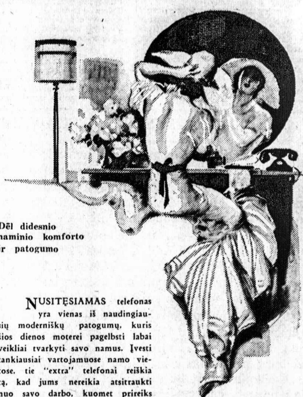
Dėl didesnio naminio komforto ir patogumo

on Friday evening, May 12, will see Kenny's Red Peppers solve the Jigsaw Breakaway as cut up by the Lithuanian Youth Club at the Cameo Ballroom, Archer and Whipple St. The price of admission is only 40c. A good time is promised all that attend.