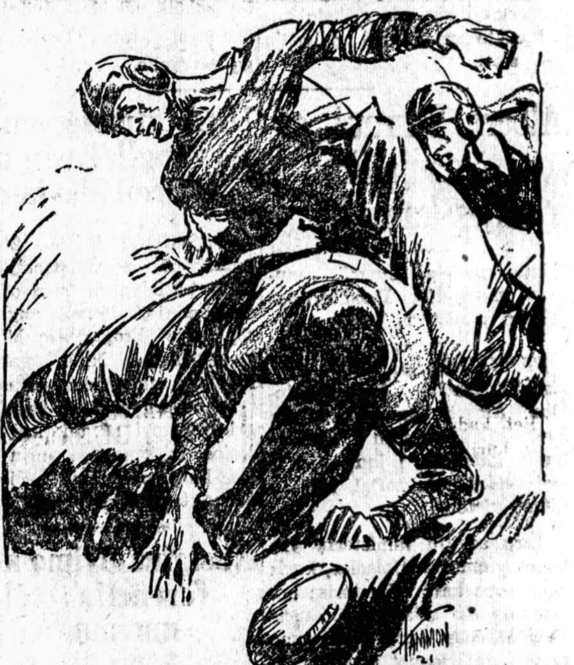
Tom left his feet with tremendous drive... the ball popped from Carlton's arms... Thorndyke recovered it!

"Who is she?" "Plenty. Back Bay, Park Avenue, plays around with art—the kind of social register which tinkles Broadway columns." Jerry wasn't usually so informative but he had had many drinks to help him keep warm. Elaine Winthrop had come through for Dorothy's estimate. Those legs Jerry had noticed were twin bits of shapely slim bamboo; every touch of her revealed the artist. "Come on, Jeff, do something," Jerry complained. A note in his voice caught Dorothy's attention. It hadn't been an inspiring game; after the first sudden touchdown the Indiana team had changed its defensive tactics, switched them smartly according to Charlie Whitney and Dorothy's knowledge of football. He answered now: "It's a tough game, Jerry. Those boys from home are getting better as they go—and I imagine they're giving Tom a good rough afternoon unless I'm mistaken."