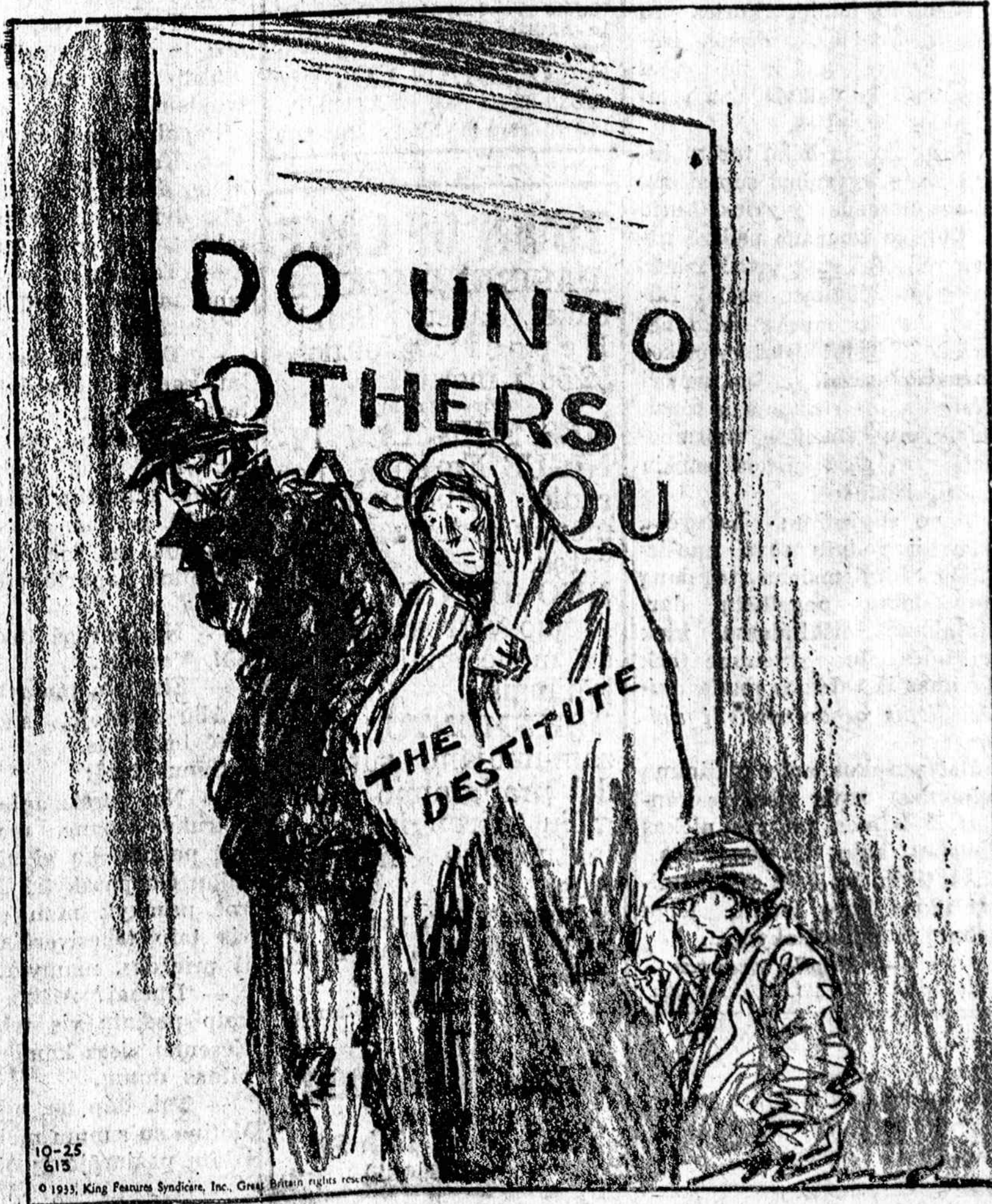
© 1931 King Features Syndicate, Inc. Great Britain rights reserved.