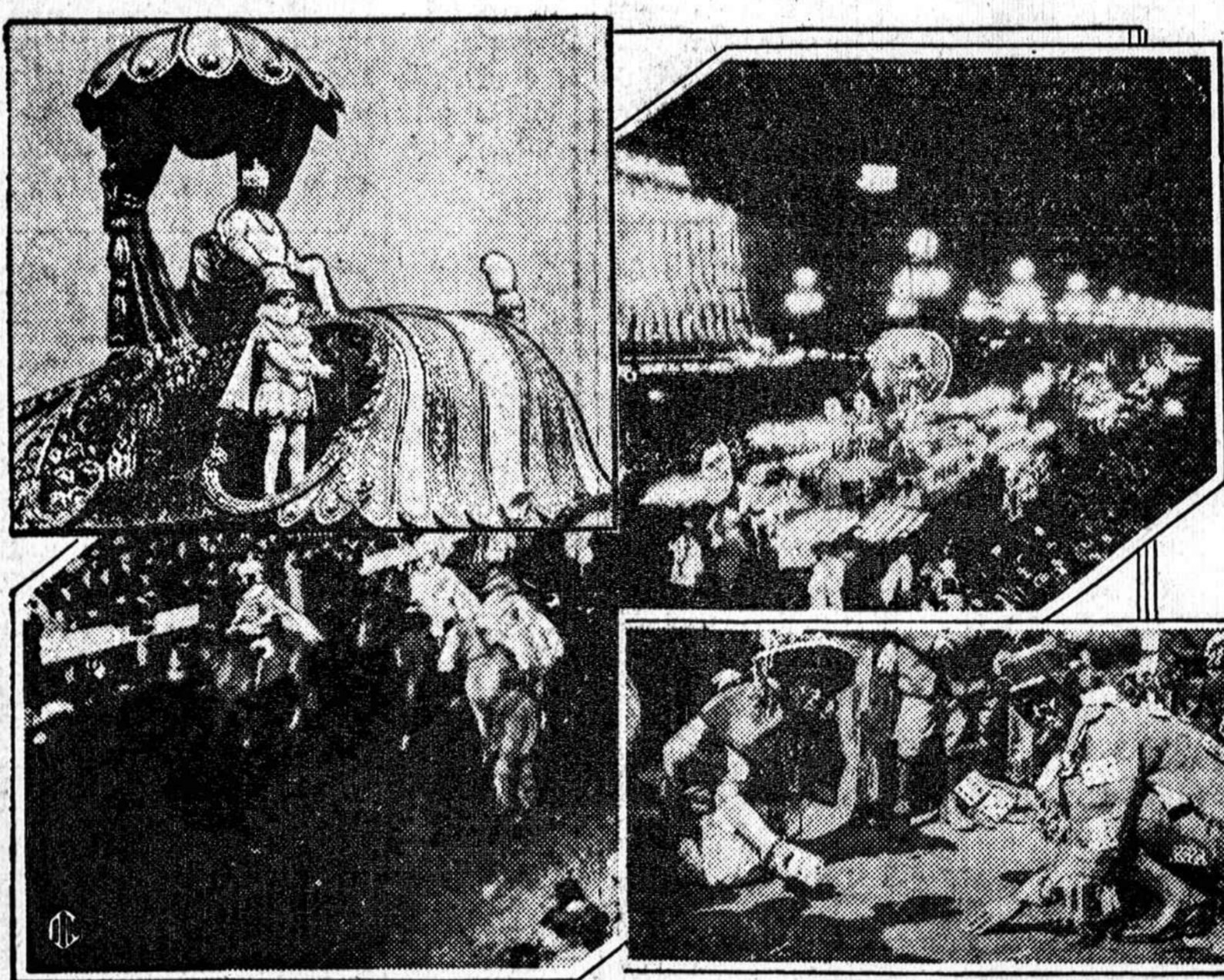
Scenes typical of the famous Mardi Gras carnival.

WASHINGTON, k. 5. — Anglikasių unija prigrumojo pasiskelbti streiką, jei iki balandžio 1 d. nebūs padaryta nauja sutartis su kasyklų savininkais.