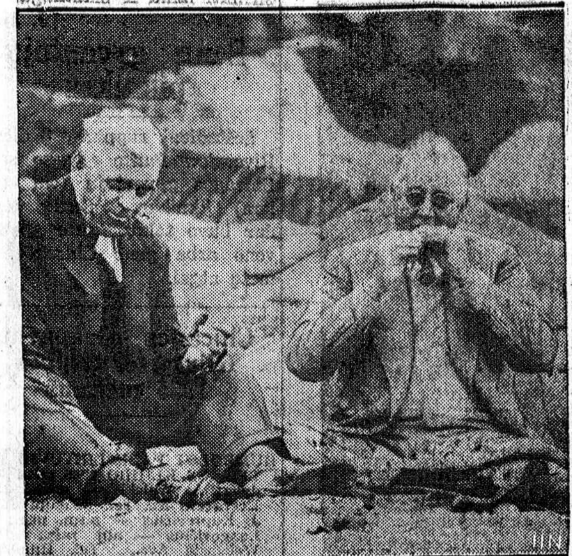
Piknikuosna mėgstame važiuoti ne vien mes paprastai piliečiai. Pabėgęs iš Baltojo Namų ir laukus su draugu, štai piknikauja ir prezidentas Rooseveltas.

gaisro nukentėjo ir plumbėrių firmos Sol Ellis & Sons patalpų adresu 5912 Grand avenue. Pastaroji firma turi savo bižilivietės įvairiose miesto dalyse ir su ja dylna nemažai lietuvių.