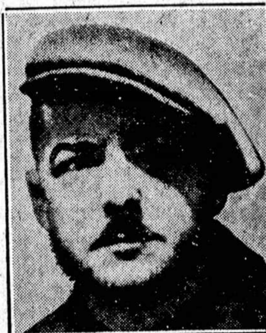
TRYŠ STREIKUOJANTI AUTOMOBILIŲ UNIJOS NARIAI, KURIE PASKELBĖ ir "skutimosi" streiką. Jie pareiškė, kad tol nesiskus, kol unija nelaimės kovos su General Motors Bendrove.