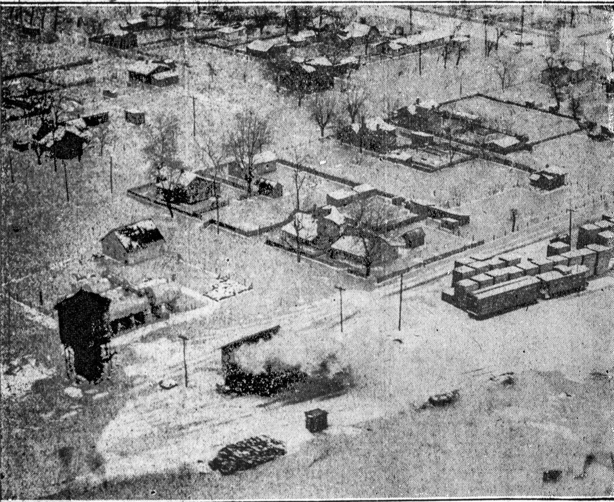
APLEIDŽIA MISSISSIPPI SLĖNĮ — Tūkstančiai Mississippi slėnio gyventojų, kurie iki šiol tikėjosi, kad potvynis juos neaplinkys, pradėjo kraustytis iš namų. Keliose vietose vandens išmušė plyšius pylimuose ir užliejo tūkstančius akrų ukio žemių. Prie Bessie, Tenn., kur pylimas neatilaukė vos nežuvo keli šimtai darbininkų.