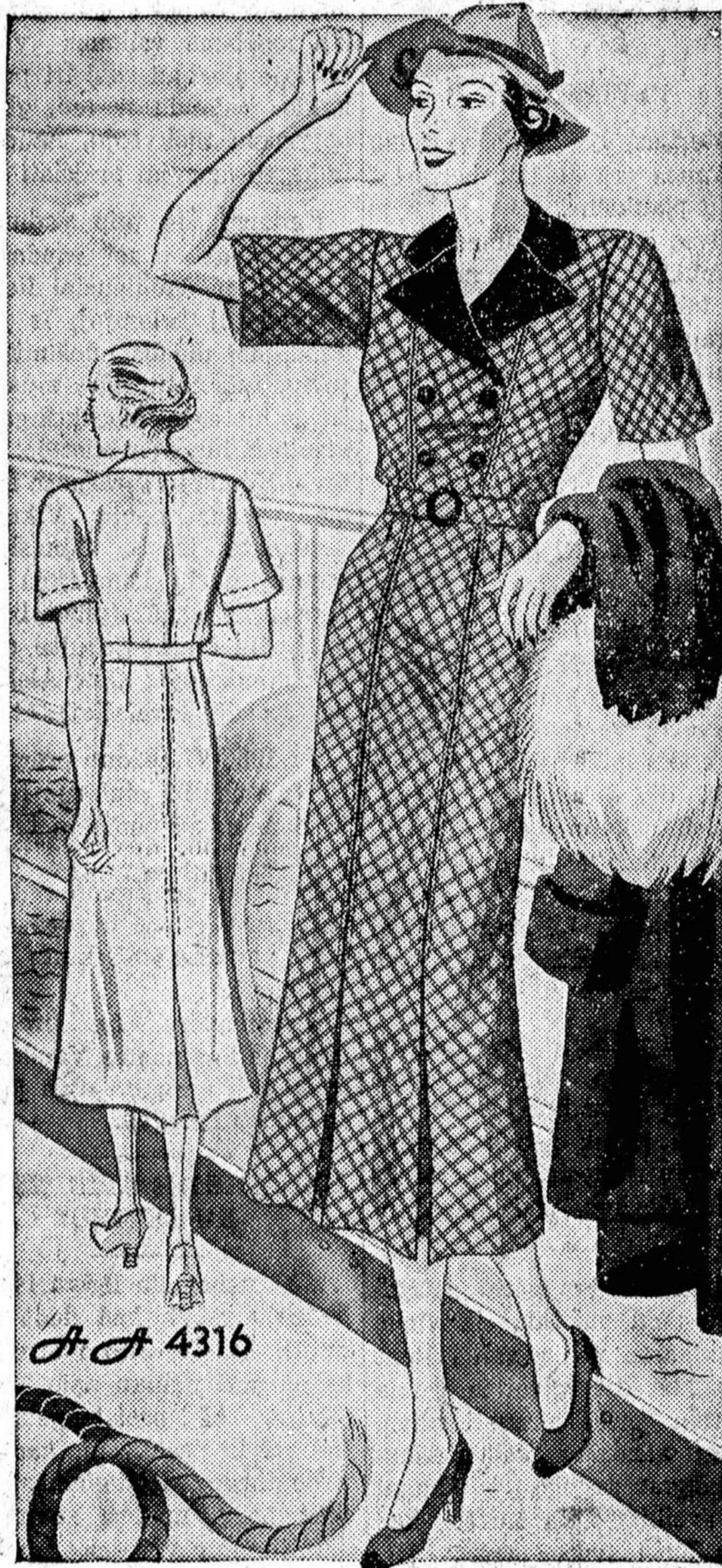
No. 4316—PAVASARINĖ SPORTO SUKNELĖ. Patogi, elegantiška ir praktiška. Galima pasiūdinti iš biele kurios naujos mados materijolo. Sukriptos mieros—14, 16, 18, 20, taipgi 32, 34, 36, 38, 40 ir 42 colių per krutinę.

Skelbimai Naujienose duoda nauda dėlto, kad pačios Naujienos yra naudingos.