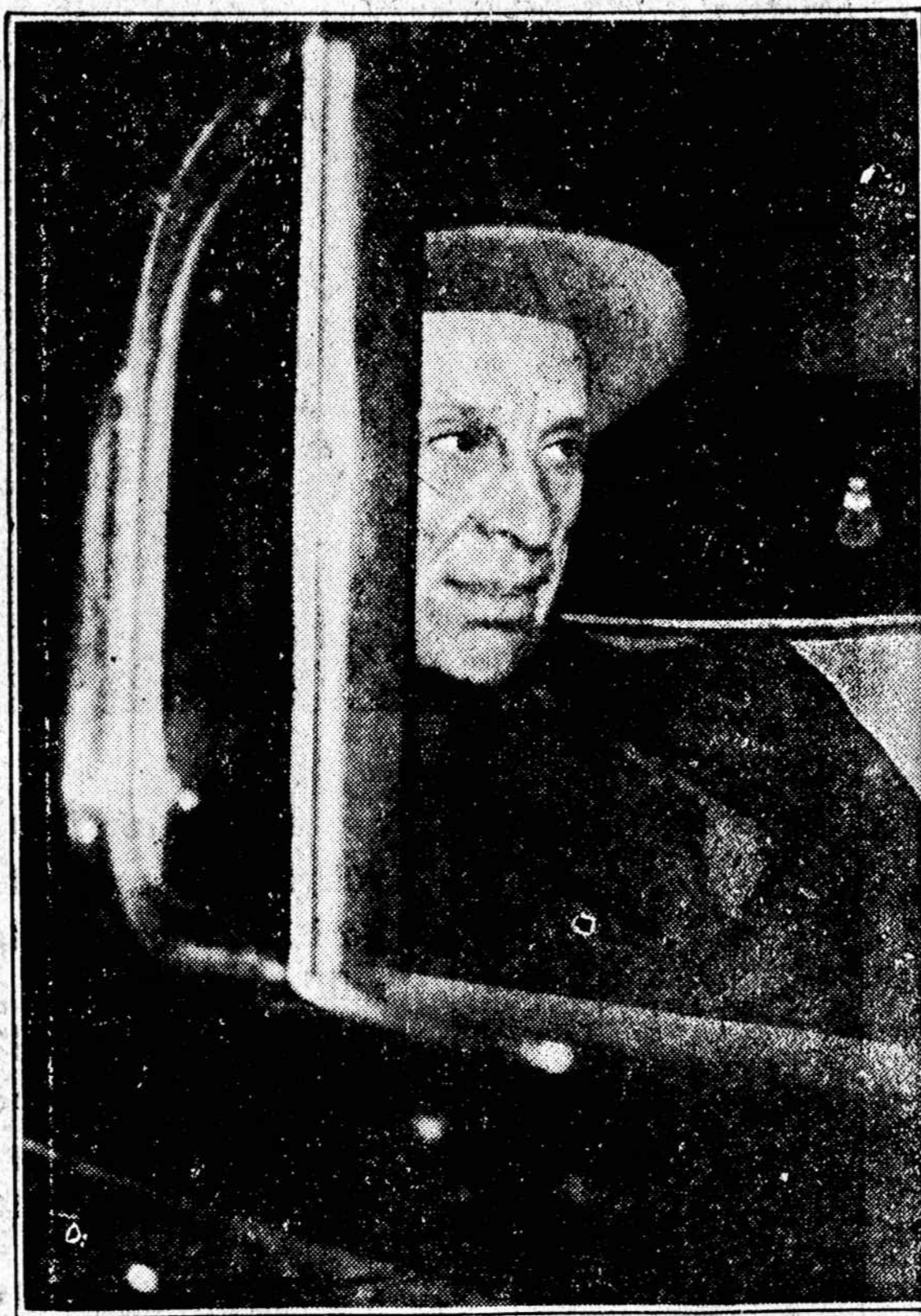
ALFRED P. SLOAN, JR., GENERAL MOTORS prezidentas, kurį New Yorke nubaubė streikuojančių G. M. darbininkų simpatizatoriai.

Tai ve kokiū budu Stalino žvalgybai pavyko išgauti Zinovjevo, Kamenevo ir keturiolikų jų kolegų "prisipažinimus". Tokiu pat budu galėjo buti apgauti ir Piatakovas su 12 kitų pasmerktųjų.