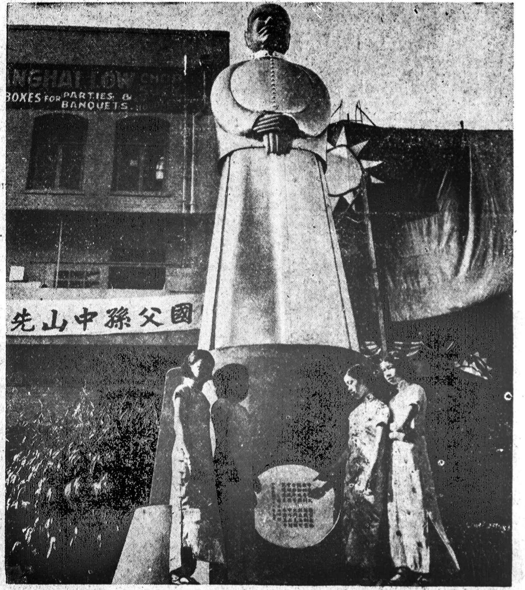
PAMINKLAS PIRMAM CHINIJOS PREZIDENTUI. — Chiniečiai San Francisco, Cal., pastatė 14 pėdų paminklą iš granito ir nerudijančio plieno Chinijos respublikos įkurėjui ir pirmam jos prezidentui Dr. Sun Yat-Sen, nes jis savo laiku yra gyvenęs ištremime San Franciscoje. Paminklas yra kurinys Beniamino Bufano. Pinigus paminklui davė Chinijos nacionalistų partija.