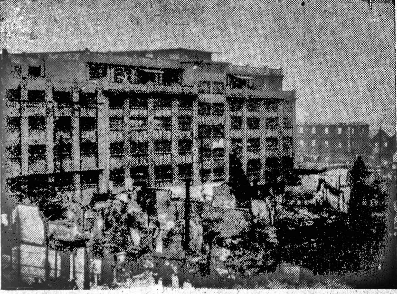
"MIRTIES BATALIONAS". — Chinijos vėliava plevesuoja virš šio triobėsio prie Soochow upelio, Shanghaiju'e, kuriame yra užsidaręs garsusis "mirties batalionas" ir kuris laikėsi per kelias savaites pridengdamas pasitraukimą iš Shanghai chiniečių armijos. Iš 450 kareivių tik apie trečdalis išliko gyvi ir pabėgo į internacionalinę miesto dalį, į kurią japonai nedrysta įeiti.