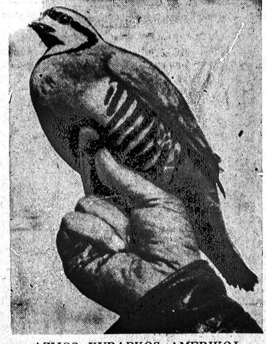
AZIJOS KURAPKOS AMERIKOJ. — Missouri konservacijos komisija įvairiose vietose valstijoje paleido 600 Chukar kurapkų. Jos yra atvežtos iš Azijos, yra pilkos spalvos su juodomis dryžėmis ir yra du sykiu didesnės už Amerikos putpeles. Dabar bus bandoma tas kurapkas užvesti ir Amerikoje.