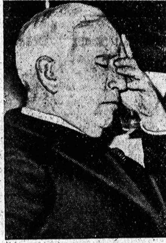
AMERIKOS ATSTOVAS. —Norman H. Davis, galva Amerikos delegacijos Briuselio konferencijoje, kuri svarsto Japonijos sutakymą su Chinija, ar tai snaudžia, ar sėdi giliai užsimąstęs nuobodžiam konferencijos posėdyje.