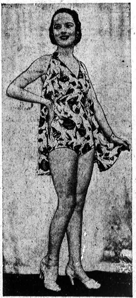
ATEINANČIAI VASARAI —Nors dar ir žiemos nesulaukėme, tečiaus madininkai jau suka galvas del ateinančių metų maudymosi kostiumų. Štai moterų maudymosi kostiumas, kuris, manoma, bus populiarus ateinančią vasarą šios šalies papludymiuose.