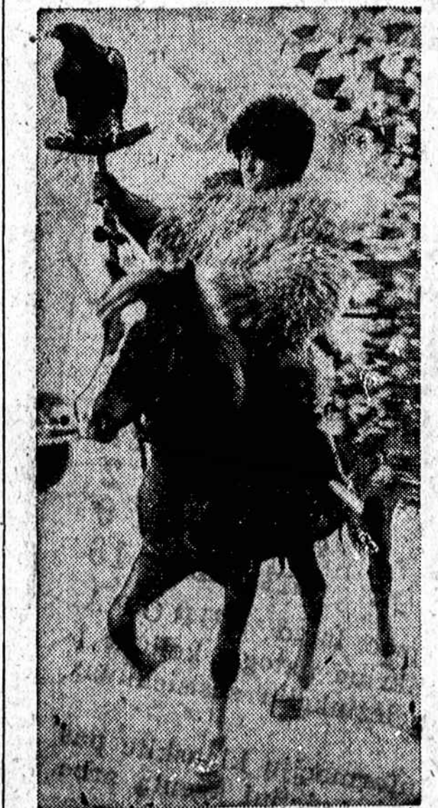
Suomijos medžiotojas jo- je medžioti mažuosius žvė- relius su prijaukintu saka- lu.

Vadinasi, socialistai (Darbo Partija) jau turi absoliučią daugumą Norvegijos savivaldy- bėse. Po pasaulio karo Norvegijos Darbo Partija buvo nuslydusi į bolševizmą. Ji buvo viena iš nedaugelio masinių darbininkų partijų Europoje, kuri "in cor- pore" įstojo į Komunistų Inter- nacionalą (kita tokia partija buvo Italijos Socialistų Parti- ja). Bet laikui bėgant Norvegi- jos darbininkai patyrė, kas So- vietų Sąjungoje dedasi, ir nuo Kominterno atsimitė. Paskui į susilėjo su Norvegijos Socia- ldemokratų Partija, ir nuo to laiko prasidėjo spartus Darbo Partijos augimas. Dabar Norvegijos valdžia jau yra socialistų rankose, — nors parlamente jie dar neturi pil- nos daugumos. Todėl socialistai yra priversti kooperuoti su li- beralais. Tačiau, jeigu Darbo Partija laimėjo absoliučią daugumą sa- vivaldybėse, tai netolimoje at-