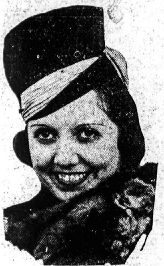
Rose Bampton, Metropolitan operos dainininkė, kuri sugrįžo iš koncertų turo Europoj dainuoti New Yorko operoj ir duoti kelis koncertus Amerikoje.