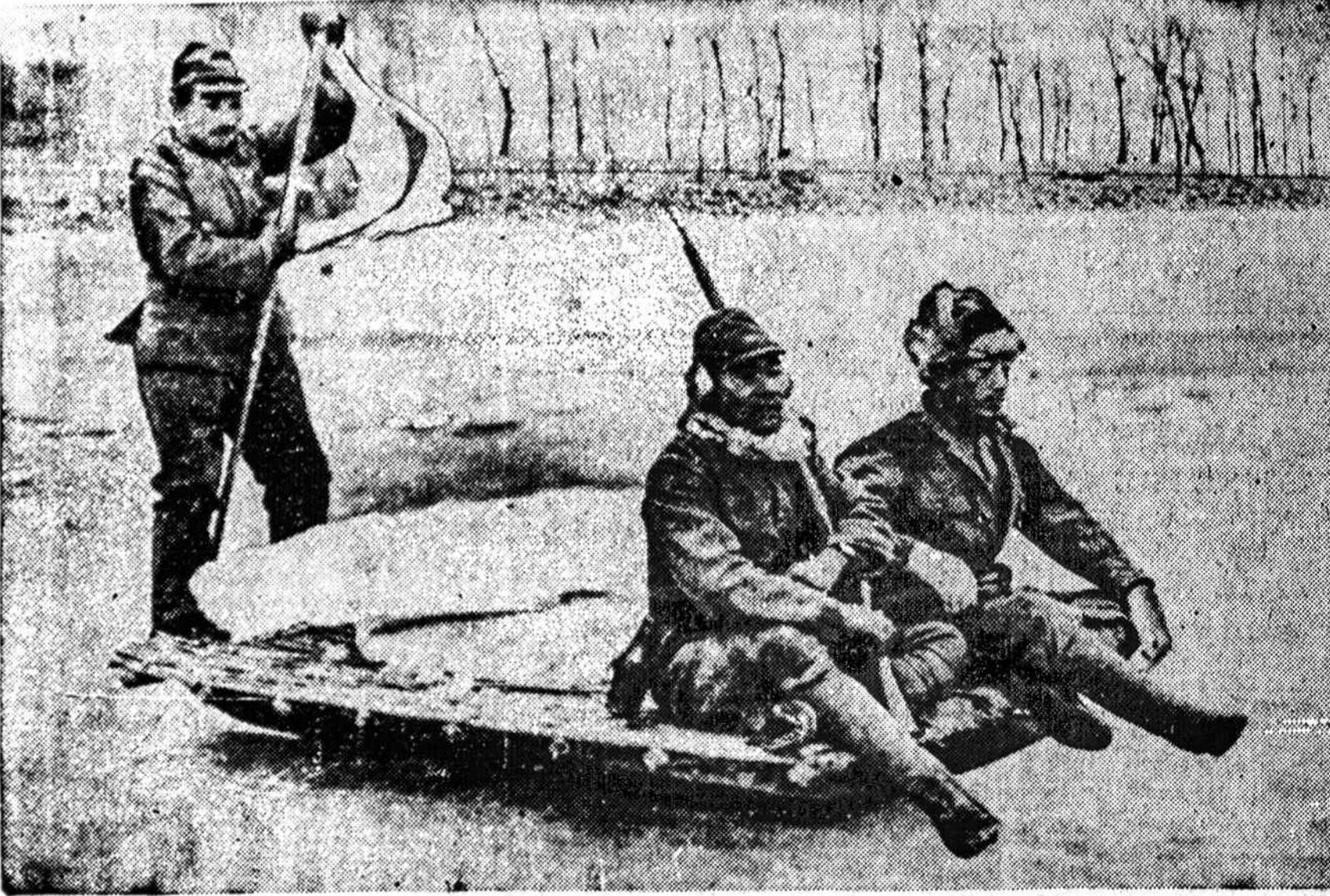
GABENA VANDENĮ JAPONAMS KINIJOJE. — P. veikslas parodo savotiškas roges, kuriomis Japonijos kareiviams Kinijos Tientsin teritorijoje tenka gabenti gėrimui tinkamą vandenį. Apleisdami kraštą, k niečiai jį patvindė, kad apsunkinti susisiekimą japonams.