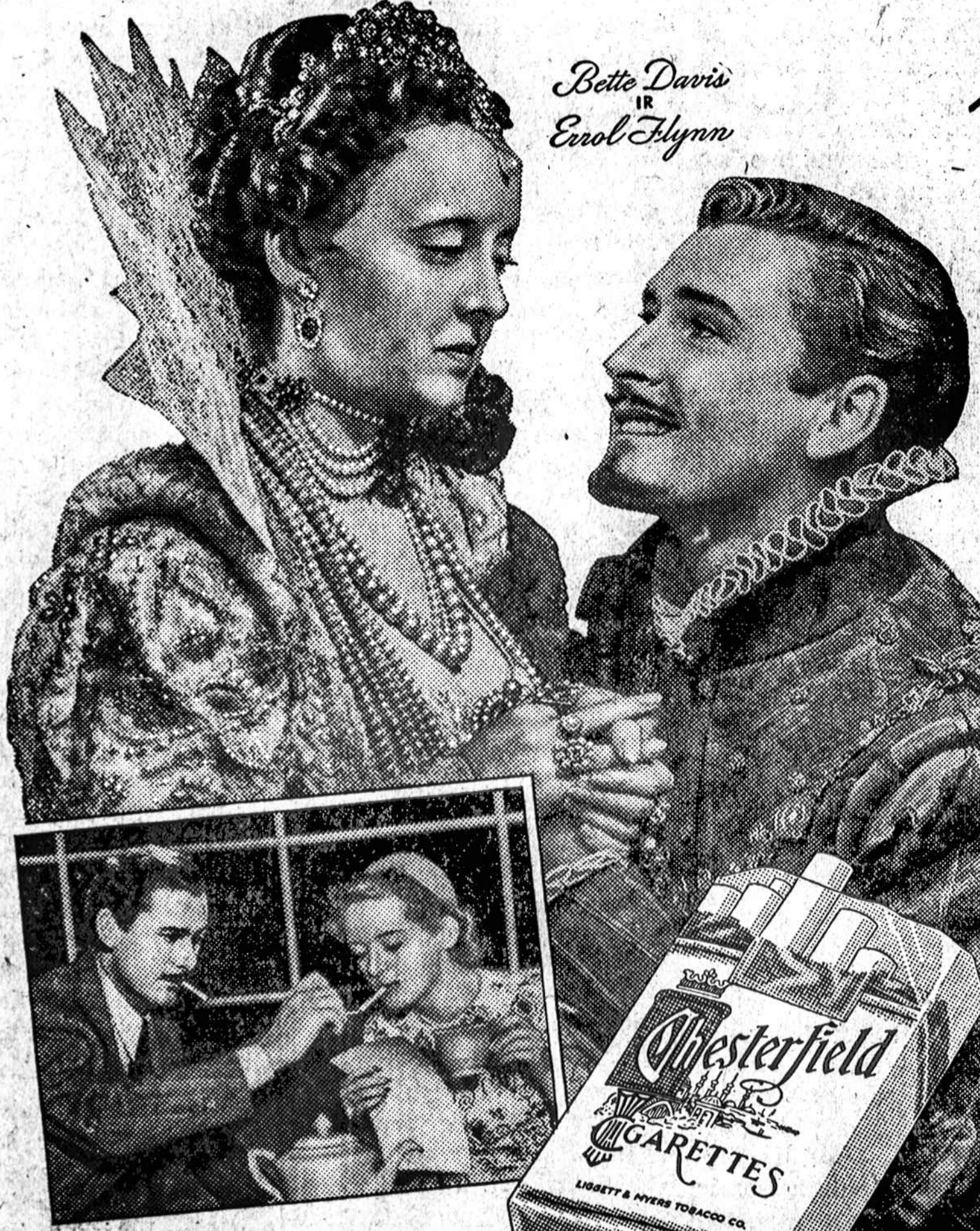
Bette Davis ir Errol Flynn