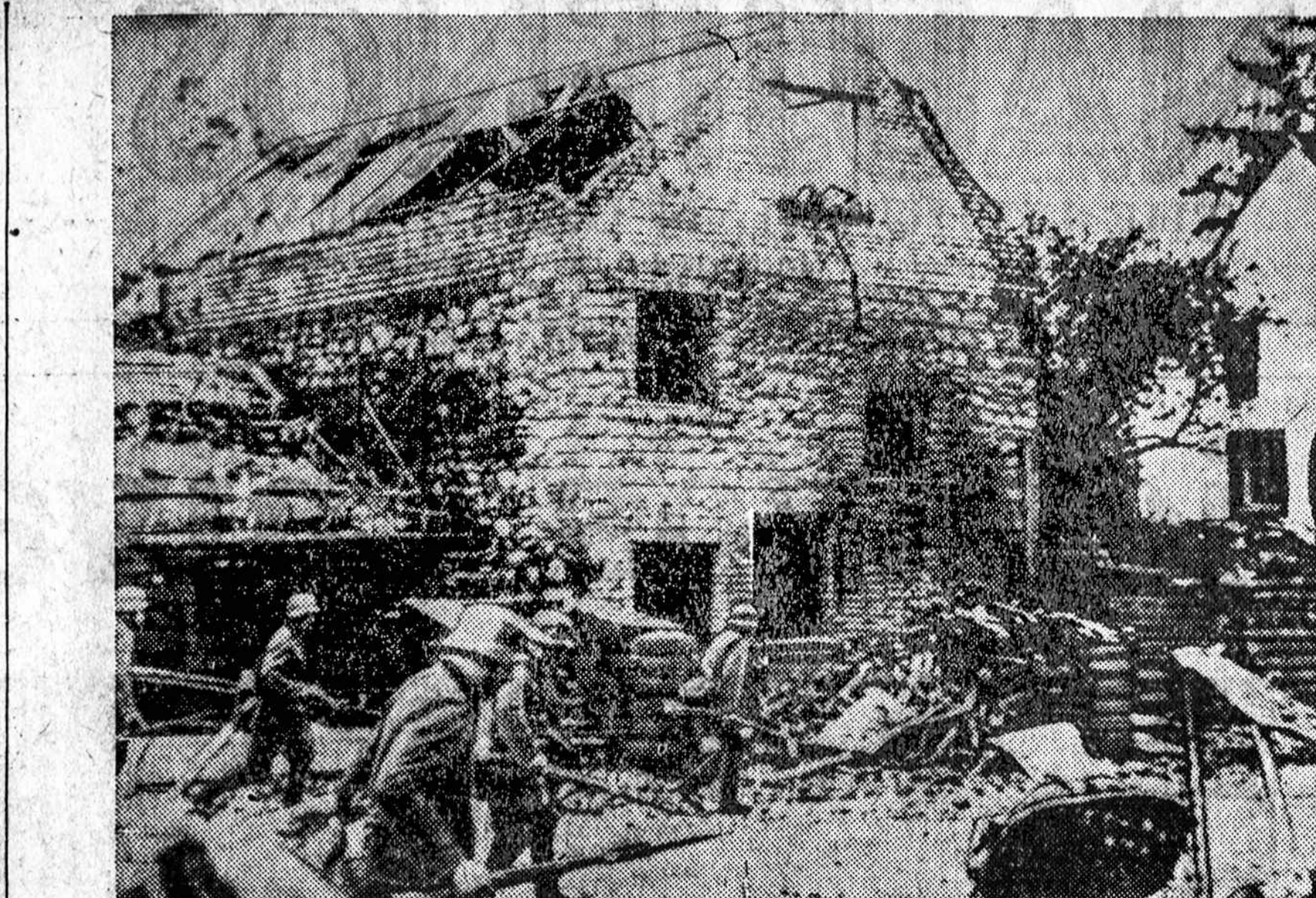
NAUJIENŲ AGCŲ TELEFOTO APLEIDO. Vokiečių kareiviai žygiuoja į kalną, kurį prancūzai buvo užėmę, bet paskui apleido.

Dabar pakalbėsime apie biblijos populiarumą. Autorius skelbia kaip faktą biblijos šventumą ir neklaidingumą vien tik dėl to, kad tiek milijonų žmonių įvairiuose kraštuose ir net prezidentas ją labai gerbia.