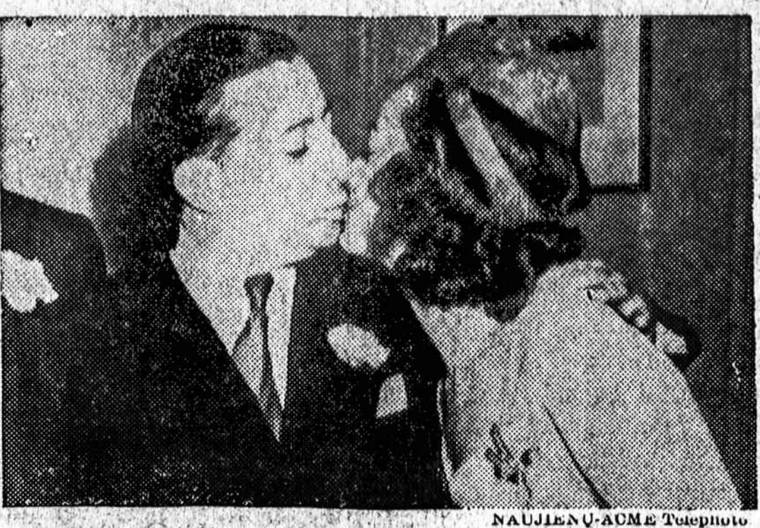
NEW YORK. — Eleanore Holm Jarrrett, kino aktorė, ir Billy Rose, promoteris ir agentas, po vedybų ceremonijų.