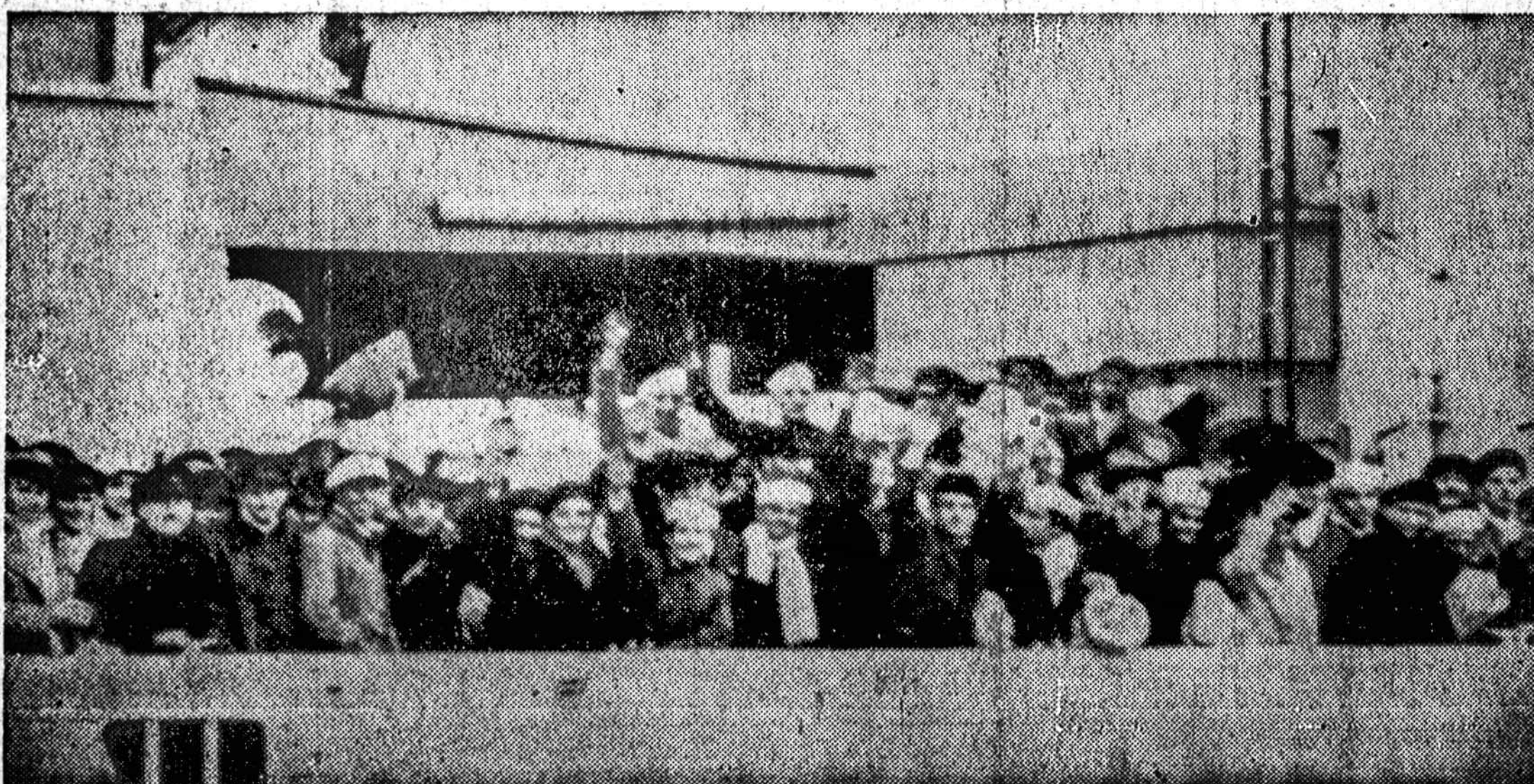
Vokiečių laivo "Columbus" įgulos nariai.