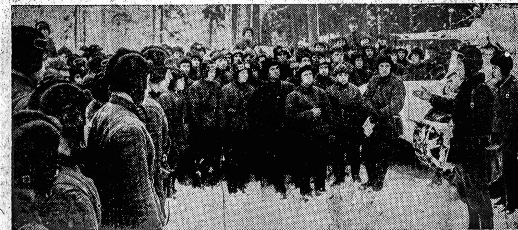
Raudonosios armijos karininkai, kurie kariauja Suomijos fronte, gauna instrukcijas.