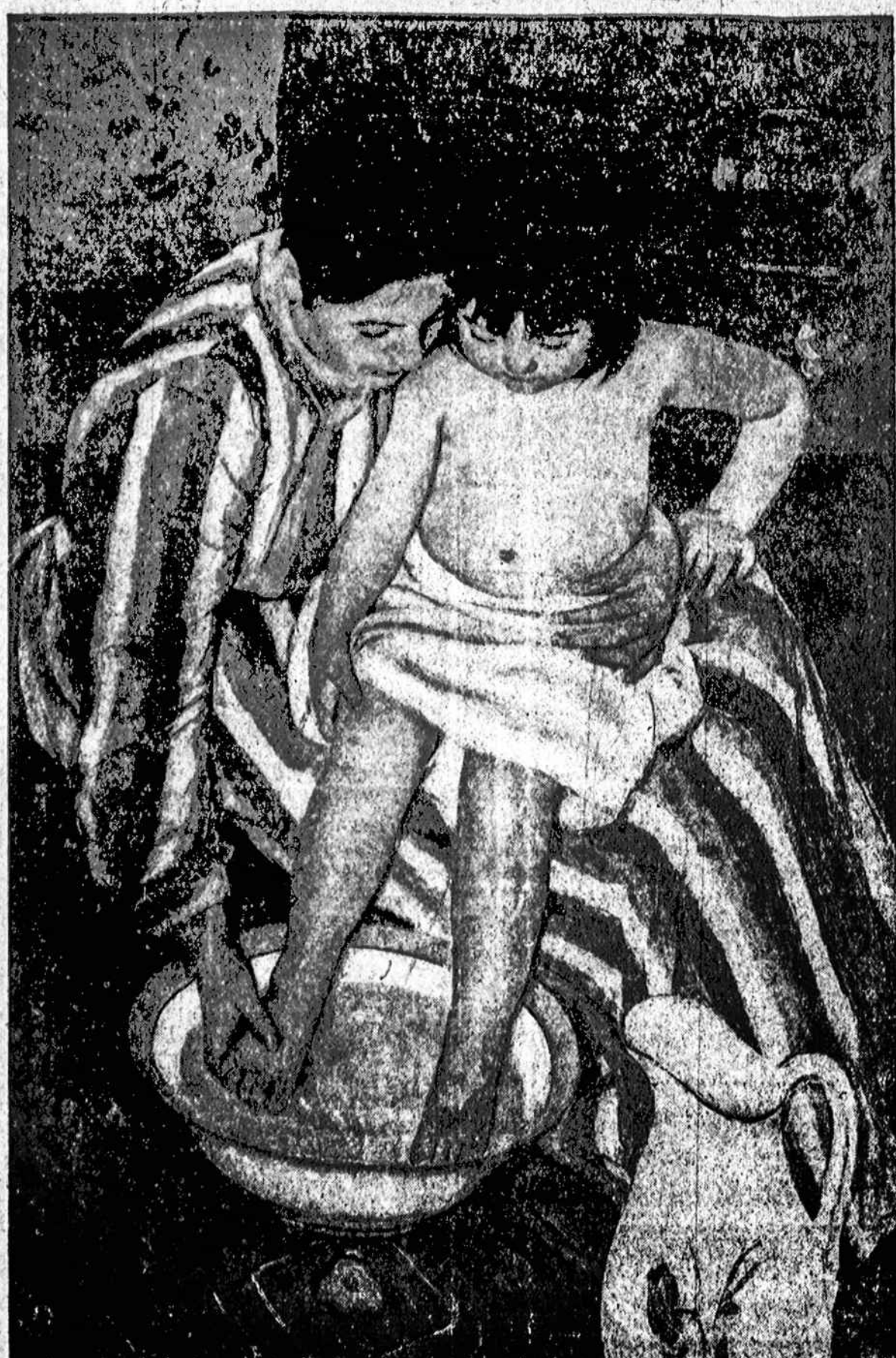
"MAUDYKLEJE" Mary Cassatt

Botticelli buvo vienas tų, kuris skaitosi stambiu šulu penkioliktą amžiaus Italijos Renesanso—S. Sausio 6 d. Findlay galerijoje, 424 S. Michigan ave., šėštadienį atsidarys Chicago's Moterų Meno Saliono paroda. Ji susidės iš 41 ekspozicijos kon-