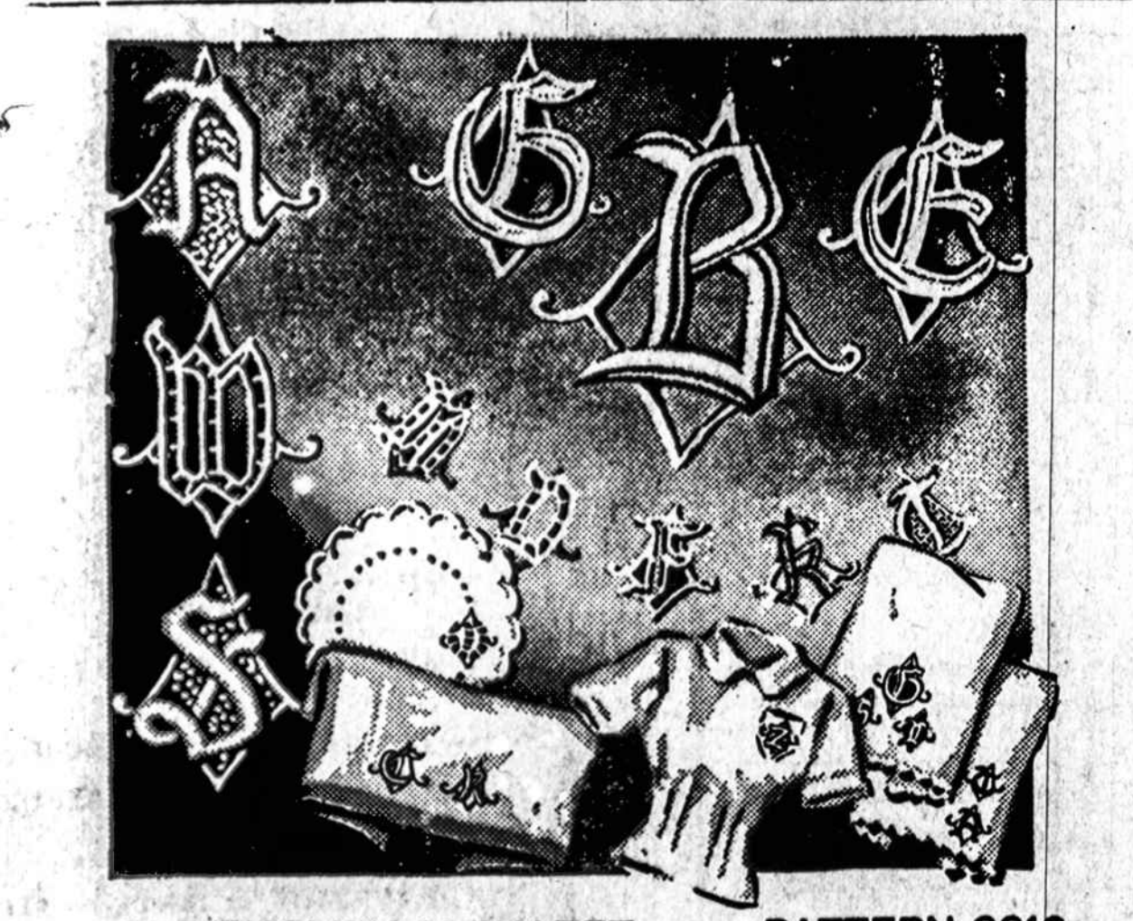
OLD ENGLISH ALPHABET PATTERN 2316 No. 2316—Padabinkite savo daiktus su raidėm.