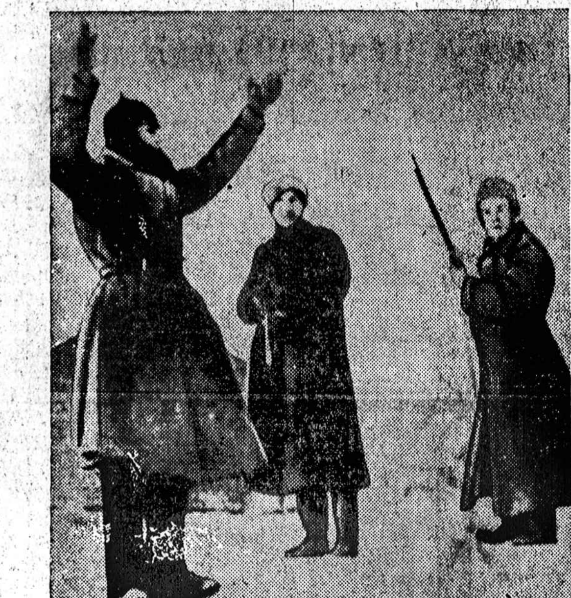
Rusų karys su iškeltois rankomis pasitūdo suomių kareiviams.