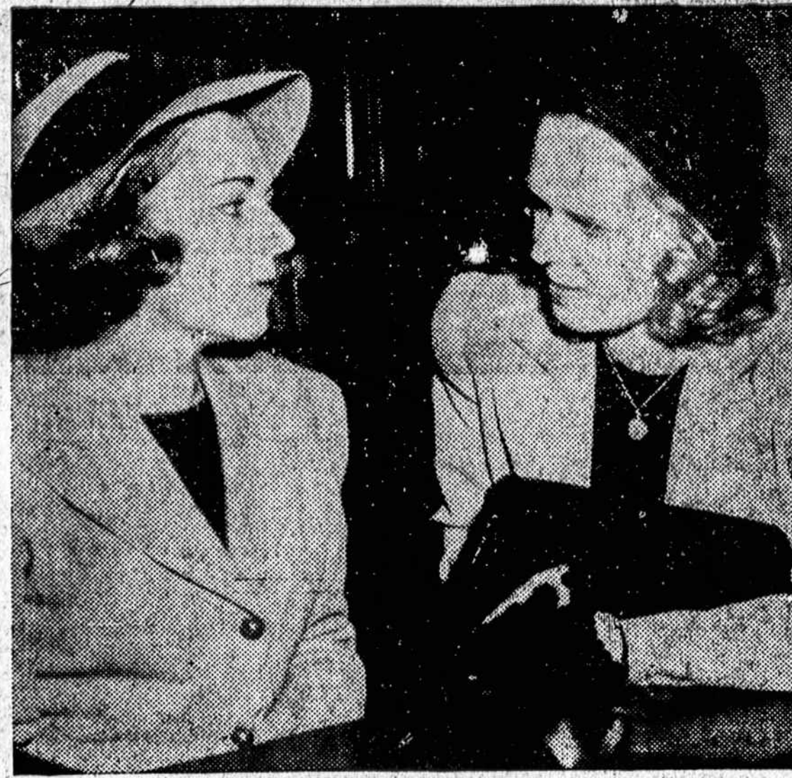
HOLLYWOOD, CAL. — Ruby Keeler, kuri gavo divorsą nuo Al Jolson, pasižymėjusio artisto.