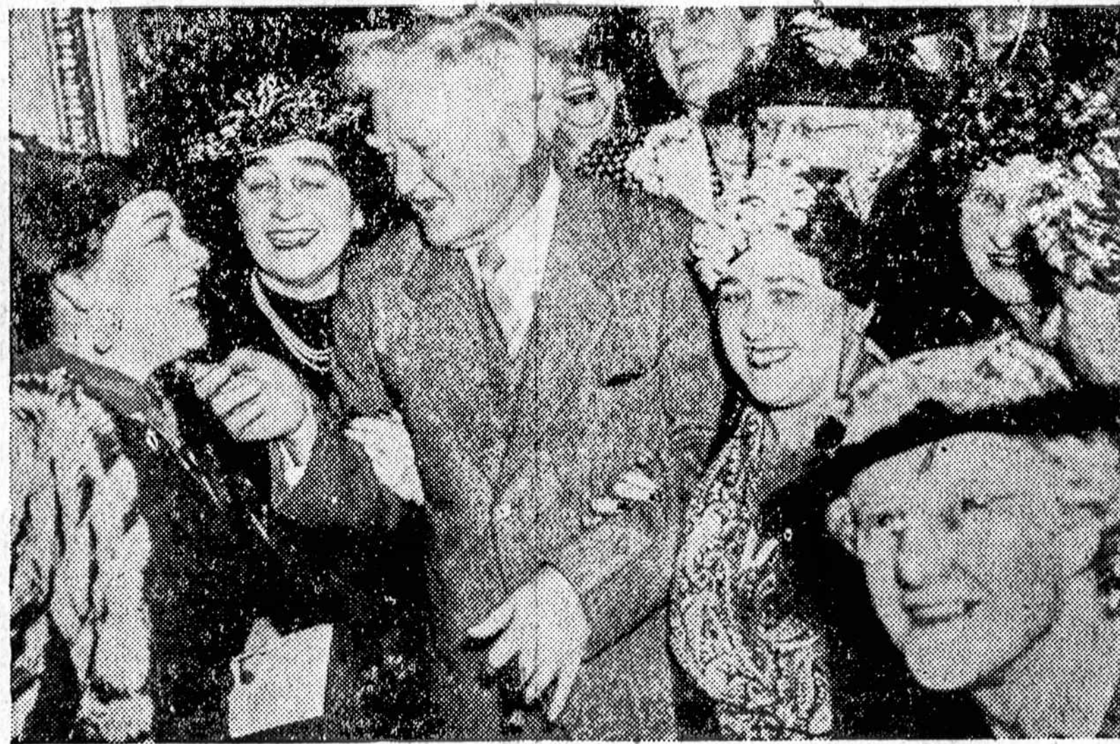
WASHINGTON, D. C. — Bobučių delegatės reikalauja, kad kongresas "bobučių diena" paskirtų spalio mėn. pirmą sekmadienį.

3 — Jeigu Vokietija ir Rusija, arba bet kuri iš abiejų šalių paskirai grasins Švedijos ir Norvegijos nepriklausomybei, tai sąjungininkai tuojau paskelbs karą Rusijai ir atsišauks Skandinavijos šalims padėti su rusais kariauti (su Vokietija sąjungininkai jau kariuoja).