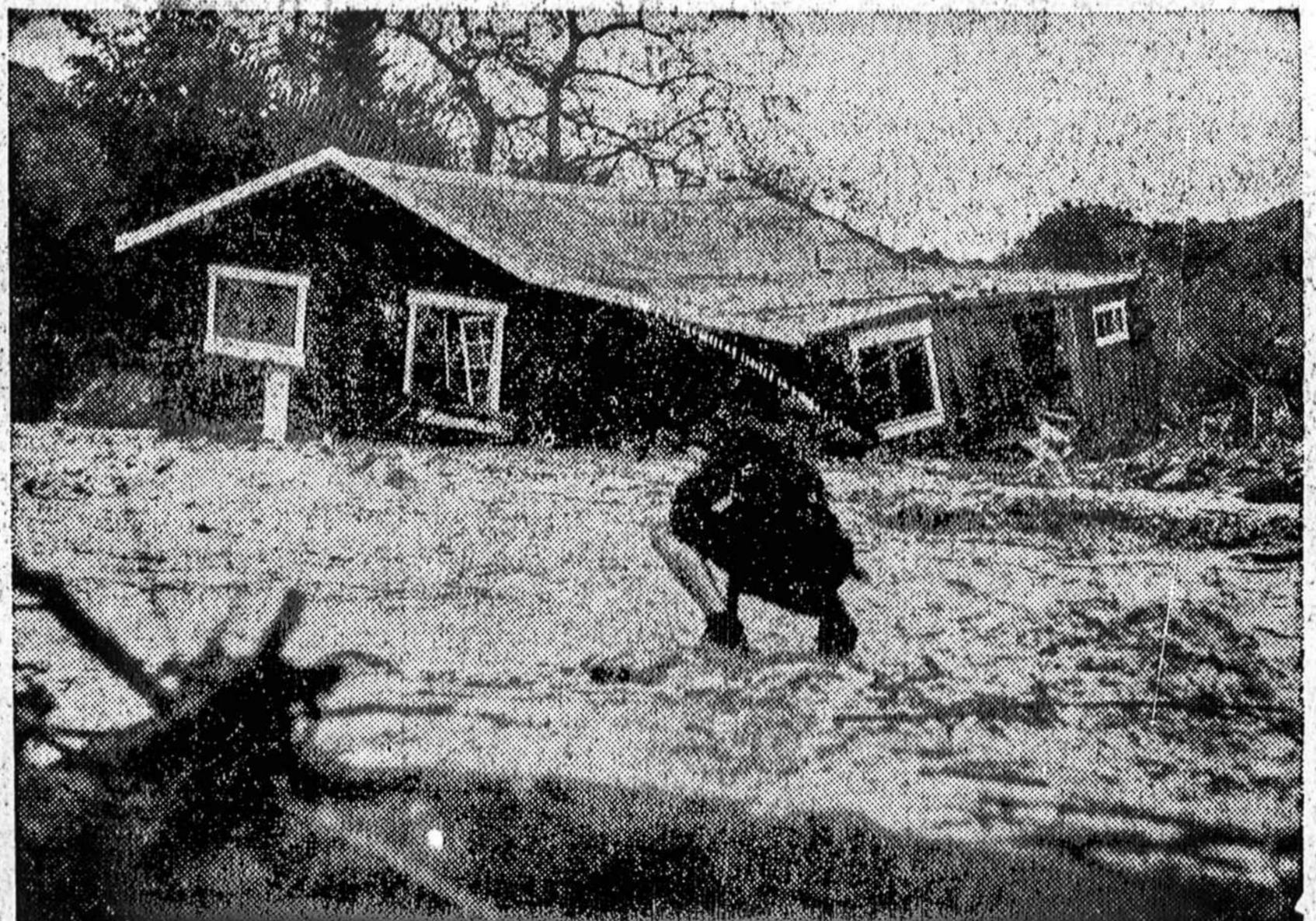
Californija mėgsta girtis savo saulėtumu, bet kada ten užėina lietus tai jau lyja. Dabartiniu metu ten užėjęs lietingasis sezonas ir apie jo smarkumą liudija šis namas, kurį vanduo iš pamatų išplovė ir nunešė pusę mylios.