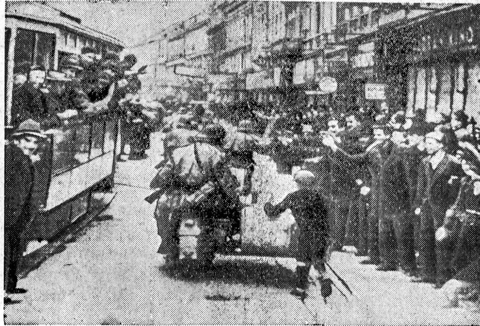
Nacių motociklistų daliniai įžengia į Zagrebą, šiaurinį Jugoslavijos miestą, kuris dabar paskelbtas naujai sukurtos Kroatų valstybės sostine. Valslybėlė paskelbta Berlyno mašinos pagaidavimu. Fotografija, perleista per vokiečių cenzūrą atsiųsta per radiją iš Berlyno.