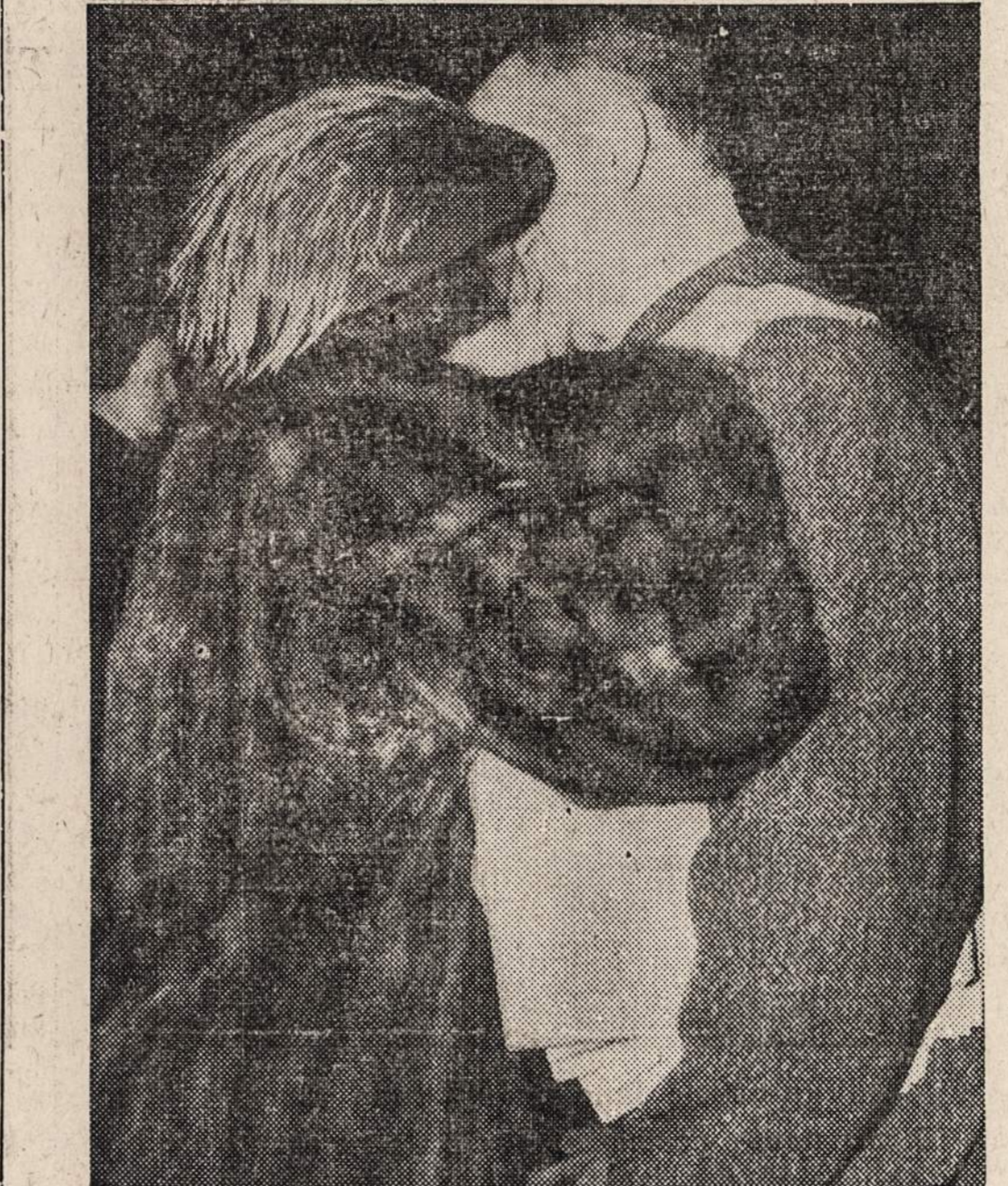
Valstybės vice-sekretorius Summer Welles atsiveikina su žmona Washingtono geležinkelio stotyje. Jis išvyko į Rio De Janeiro atstovauti Jungtines Valstybes Amerikos respublikų užsienio reikalų ministrų konferencijoje.