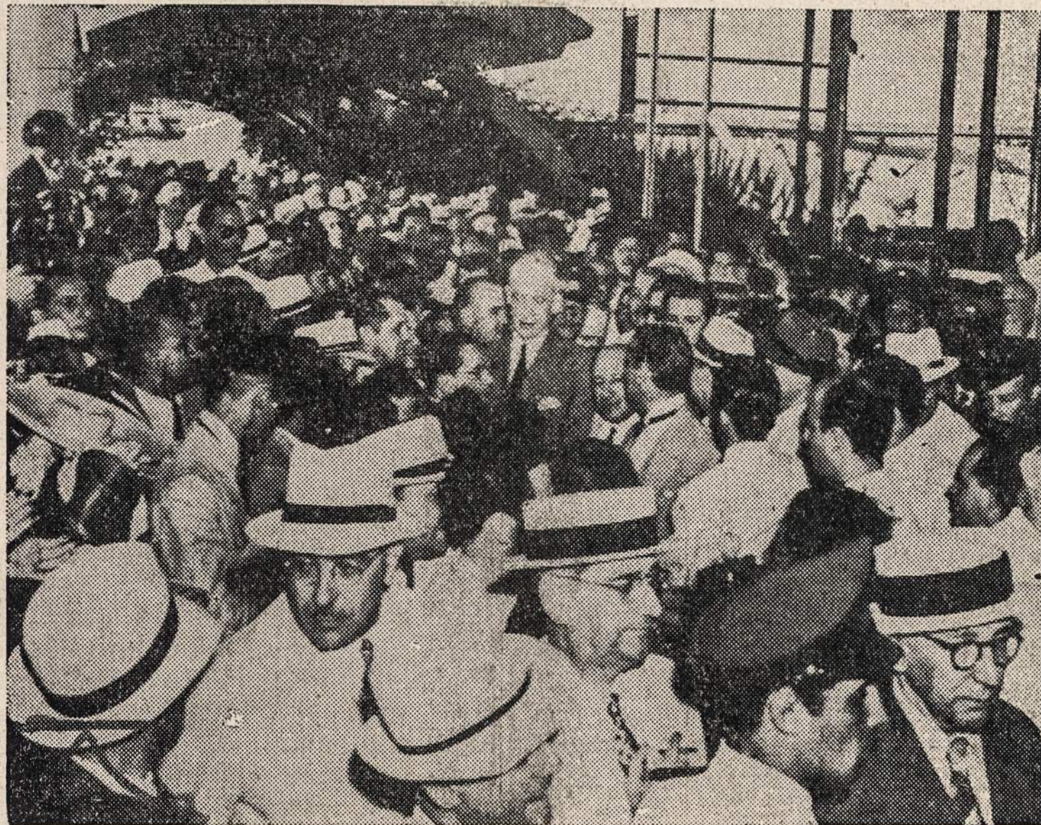
Milžiniška minia Rio de Janeiro gyventojų susirinko stojant sulikti atvykusį J. V. valstybės vice-sekretorių Sumner Welles, amerikiečių delegacijos ir Pan-Amerikos konferenciją galvą.