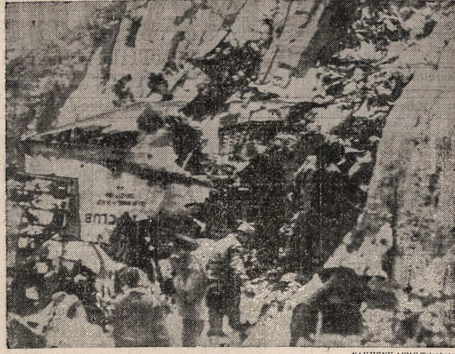
Po ilgų ir pavojaus pripildytų valandų kopimo kalnuose, gelbėtojai pasiekė netoli Las Vegas sudužusio lėktuvo likučius. Nelaimėje žuvo 22 asmenys, jų tarpe 15 Armijos lakūnų ir filmų artistė Carole Lombard. Kairėj matosi dalis lėktuvo uodegos.