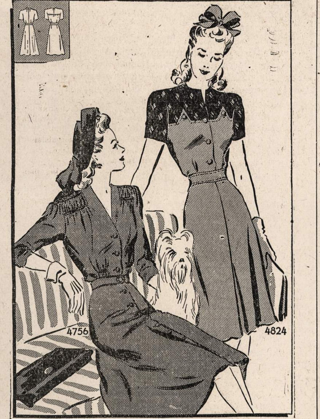
No. 4756 ir 4824—Naujos mados suknišos, su vėliausio stiliaus pėčiai. Mieros, 14, 16, 18, 20; taipgi 30, 32, 34, 36, 38, 40.

Norint gauti vieną ar daugiau veš nurodytų pavyzdžių prašome iškirpti paduotą blankutę arba priduoti pavyzdžio numerį pažymėti mierą ir aiškiai parašyti savo vardą pavardę ir adresą. Kiekvieno pavyzdžio kaina 15 centų. Galite pasiųsti pinigus arba pašto ženkleliais kartu su užsakymu. Laiškus reikia adresuoti: Naujienos Pattern Dept., 1739 So. Halsted St., Chicago, Ill.