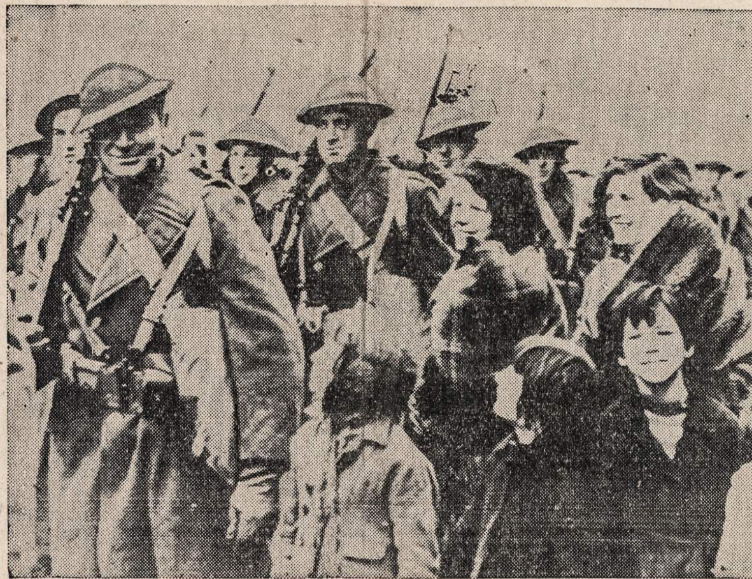
Sypsenėmis pasipuošę airiai žygiuoja šalia amerikiečių kareivių, kurie šiomis dienomis iškeldinti Šiaurės Airijoje. Jie maršuoja į barakus. Paveikslas atsiųstas kabeliu iš Londono.