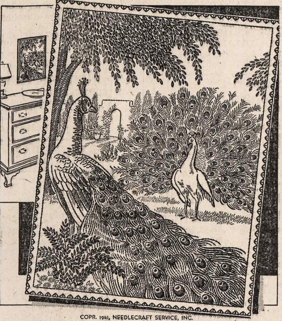
WALL HANGING PATTERN 2985 No. 2985 — Išsiuvinėjimas jūsų kambariui papuošti.

CRANE COAL COMPANY 5332 So. Long Avenue Telefonas PORTSMOUTH 9022 WEST VIRGINIA Pocahontas Mine $8.35 Raus iš gerų mainų, daug dulkių išimta. Petkanti 5 Tonas ar Daugiau. Smulkesni Yra Daug Pigesni. BLACK BAND LUMP $10.50 Sales takasai ekstra. CITIES SERVICE PETROLEUM $10.50 ARBA COKE