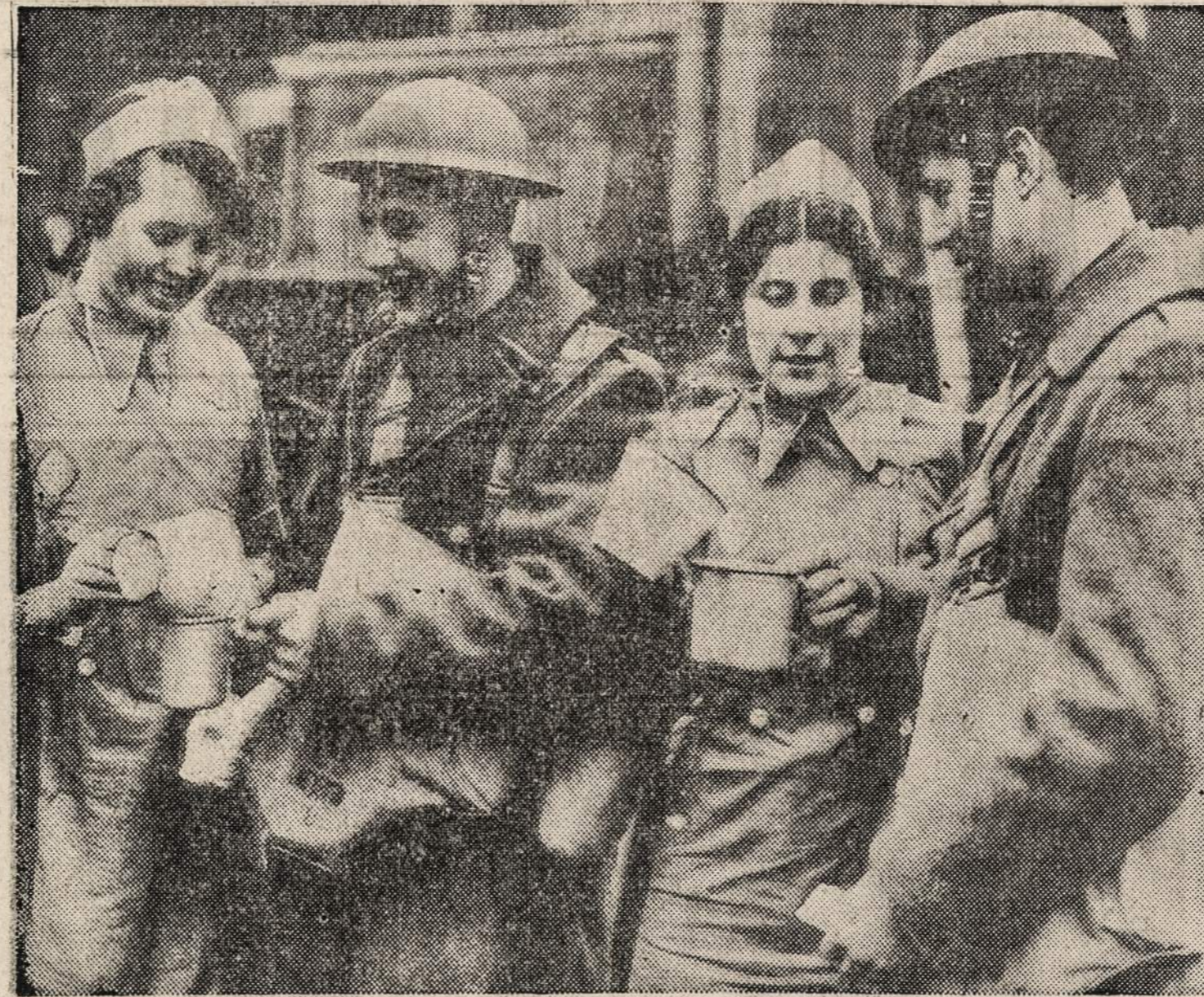
Anglai yra žinomi dideliu arbata pamėgimu. Čia jie vaisina tuo skystimu ir amerikiečius karius Šiaurinėje Airijoje.

tolerancija, o taipgi ir lietuviš-ku nuosirdumu. Jis yra vienas iš gabiųjų mūsų kolonijos vei-kėjų.