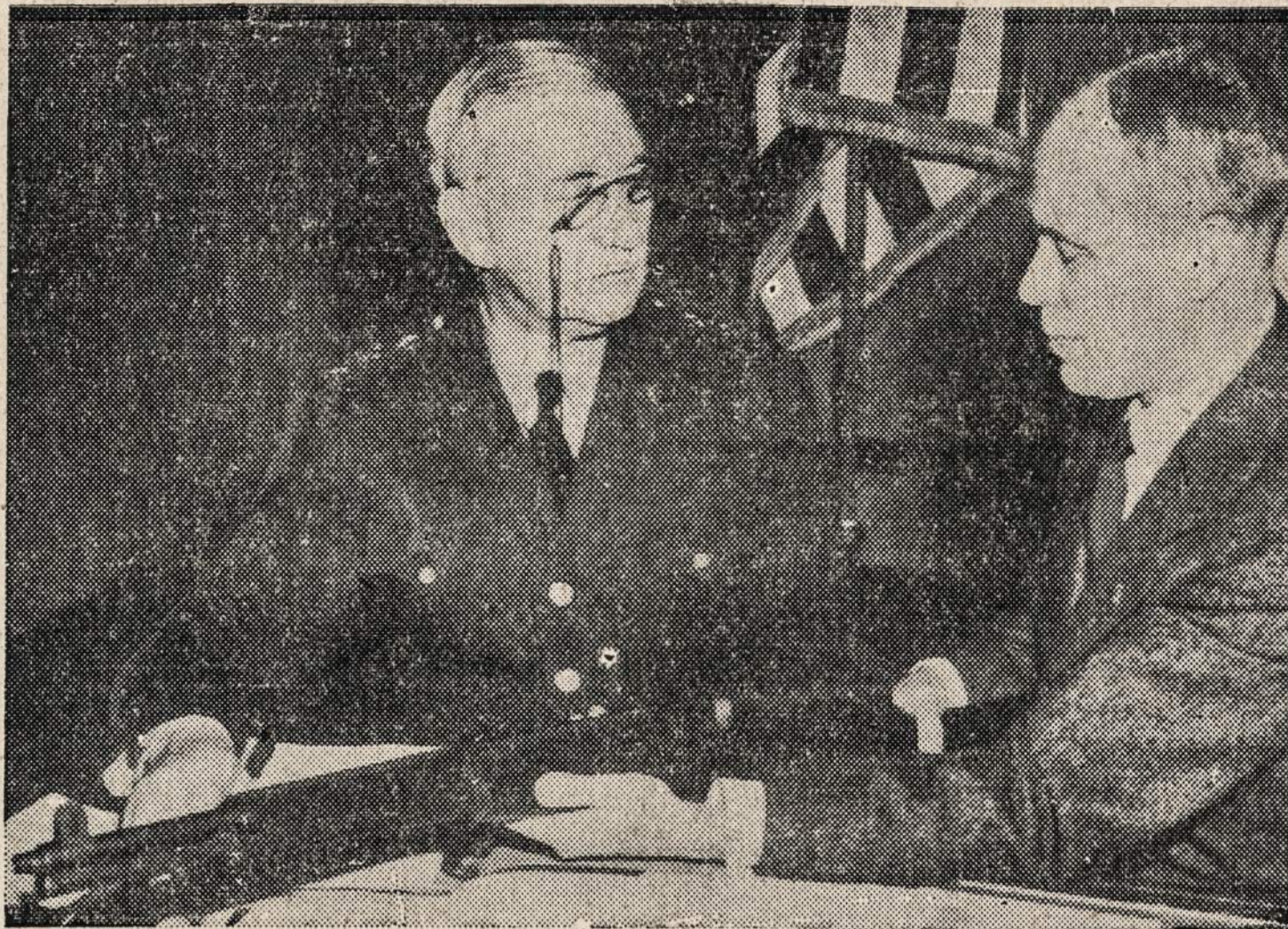
Leit. Gen. William Knudsen, Karo Departamento produkcijos direktorius, pirmu kartu užsivilkęs karišką uniformą, aptaria naują ginklą su Karo vice-sekretorium Robert Patterson.