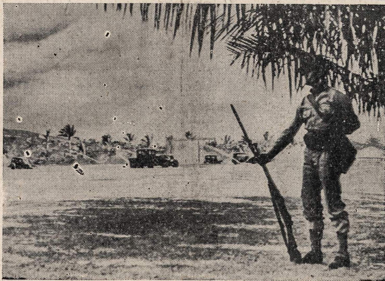
Seni, niekam netikę automobiliai, "džilapės", išdrakityta po Honohulu golfo aikštes, kad jose negalėtų nusileisti priešų lėktuvai. Prie aikščių stovi tuolinė karių sargyba.