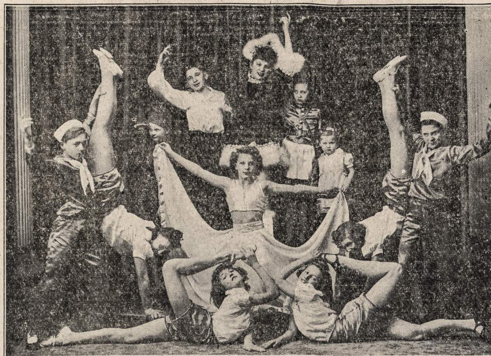
ANDRU'S ŠOKĖŲ GRUPĖ

Pradedant pirmadieniu Chicagoje pradės veikti federaliai patvarkymai, kurie suvaržo civiliams automobilistams ir nudevėtų padangų atnaujinimą. Tas daroma sutaupti tam tikrą gumos rūšį, kuri yra naudojama tam tikslui.