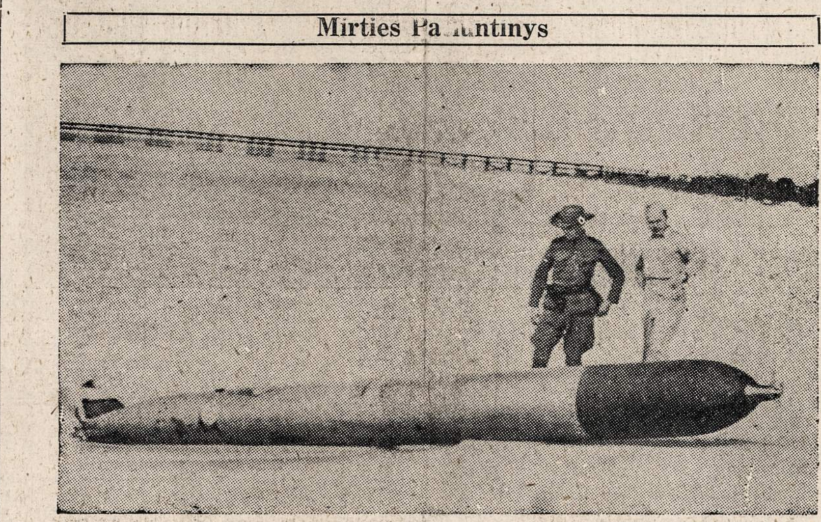
Mirties Pa antinys Olandų ir J. V. karininkai apžiūri torpedą, kurią prieš submarinas iššovė netoli Aruba miestelio, Vakarinėse Olandų Indijose. Torpeda nesprogo ir ją kiek vėliau bangos išplovė krantan. Po to kai ši fotografija tapo nuimta, burys olandų manydami, kad torpeda yra negra, pradėjo ją iš arčiau tyrinėti. Sovinys sprogo ir keturi olandai tapo užmušti.

—Šiandien prasidėjo Leono Blumo, gen. Gamelin, Daladier ir kitų byla. Prancūzijos socialistų lyderis Leon Blum pasakė kalbą, kurioje labai sunkiai apkaltino visą dabartinį Prancūzijos režimą. Prancūzijos dar tebėra respublika, sako Blum, o pagal respublikos įstatymus mane gali teisti tik senatas. Blum patarė teismui pasiskelbti nekompetentišką šiai bylai svarstyti. Gen. Gamelin nedaivauja teisme RIOM, Prancūzija, vas. 19 d.—Kai metus iškalintas Leon Blum baigė savo kalbą, tai teismas nutarė nutraukti posėdį ir apsvarstyti Blum padarytus pareiškimus. Gen. Gamelin pareiškė, kad jis buvo apkaltintas politikos sumetimais ir jam neleista organizuoti gynimasis. Gamelin patarė abiem savo advokatams jo visai neginti ir šiame teisme visai nedalyvauti. Kiniečiai sumušė Tai kariuomenę ČUNKING, Kinija, vas. 19 d.—Kiniečių kariuomenės daliniai, kurie įsiveržė į šiaurinę Tai valstybės dalį, visiškai sumušė Tai valstybės kariuomenės dalinius, norėjusius pastoti kelią kiniečiams. Kiniečių kariuomenė artėja