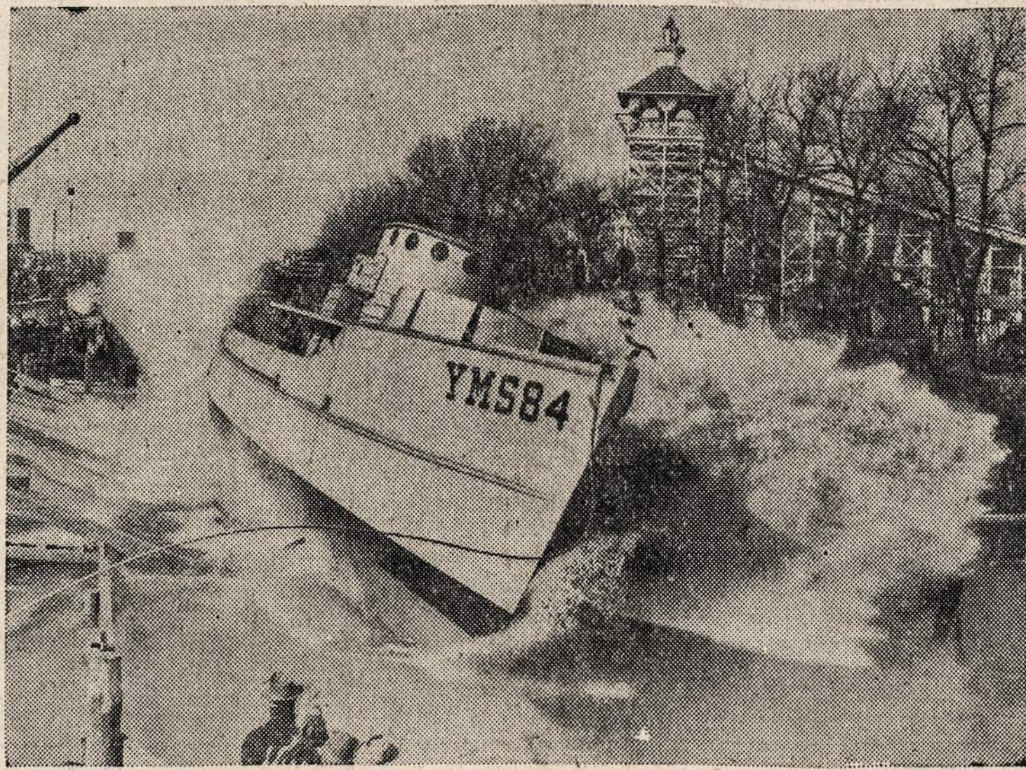
Chicagos upėn nulaidžiamas naujai pastatytas J. V. Laivynui laivas YMS-84. Tai pirmas Laivynui pastatytas Chicagoje laivas nuo pereito karo. Po reikiamų išbandymų jis vyks pareigoms okeane.