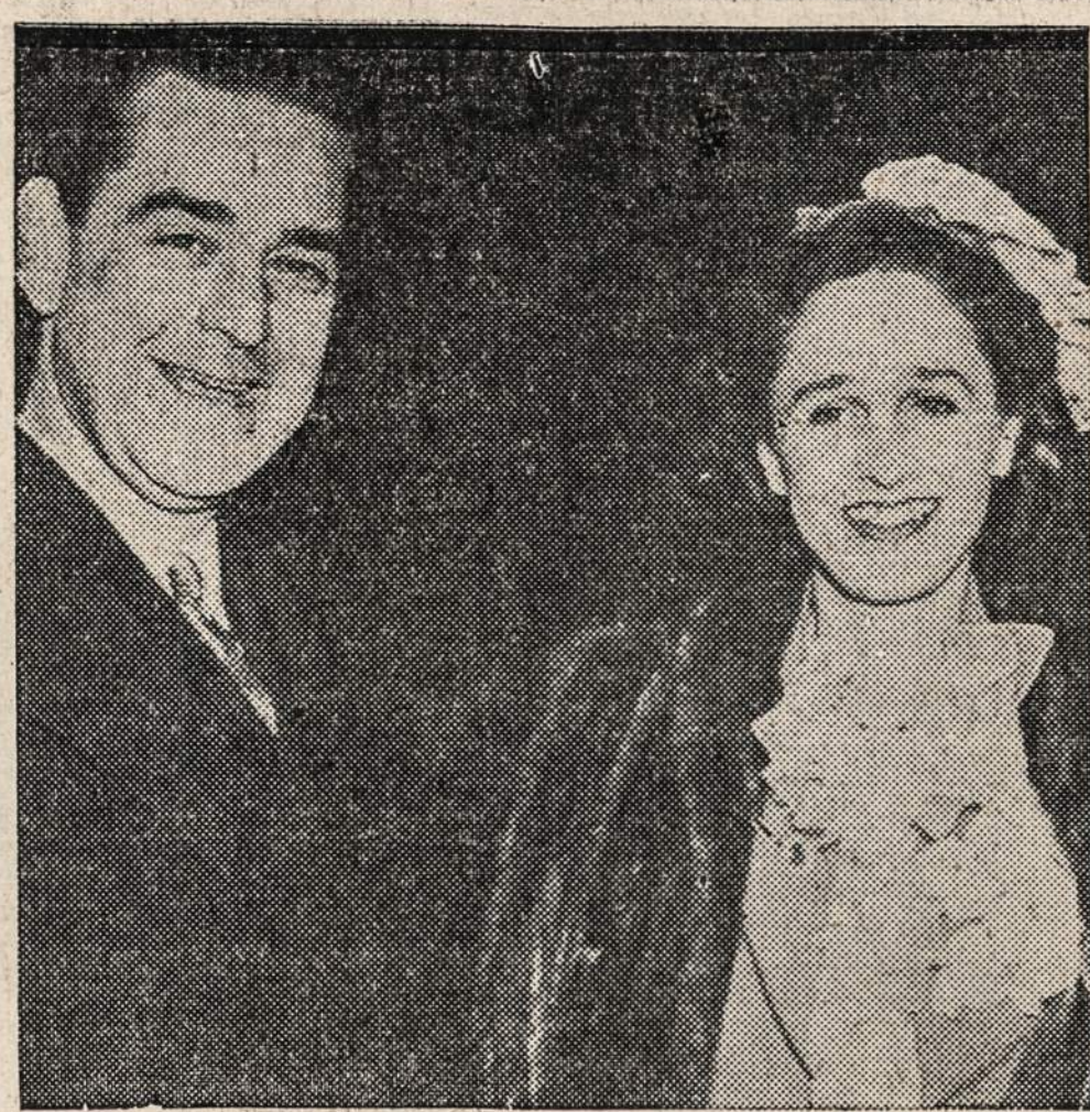
Betsy Cushing Roosevelt, buvusi James Roosevelt (Prezidento vyriausio sunaus) žmona, sekmadienį ištekėjo už turtuolio John Hay (Jock) Whitney. Ji su Rooseveltu susilaukė 2 kudikių.

laiko ir iškaščių. Sakoma, kad yra buvęs toks atsitikimas: