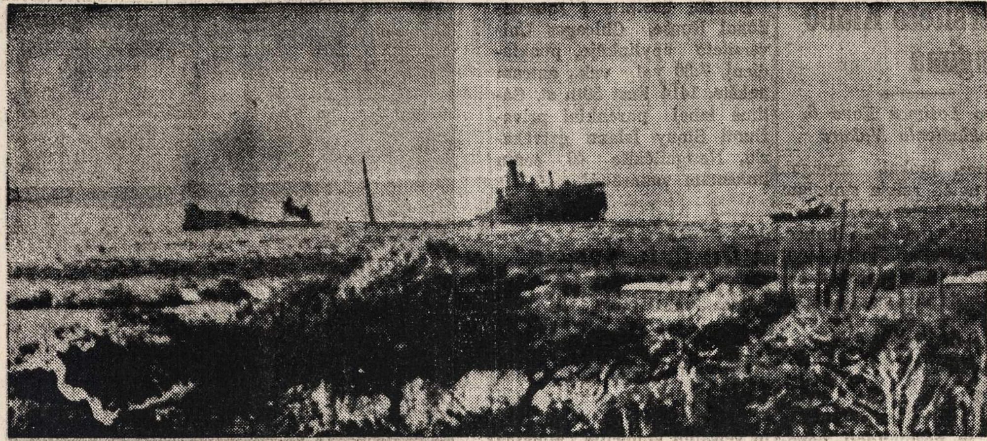
Priešo submarinai šiomis dienomis prisiartinio prie Aruba miestelio, Vakariniuose Olandijos Indijose, ir smarkiai apšaudė aliejaus valykla. Puolimo metu torpedavo ir pasitaikiusius laivus. Čia vienas anglų laivas (tankeris), kurį torpeda "perlaužė" į pusę, velkamas krantan.

Gana teisingas tas posakis, kuris sako, jog tik kalnas su kalnu nesusitinka, o žmogus su žmogumi susiduria ten, kur mažiausiai tik susitiktų. (Bus daugiau)