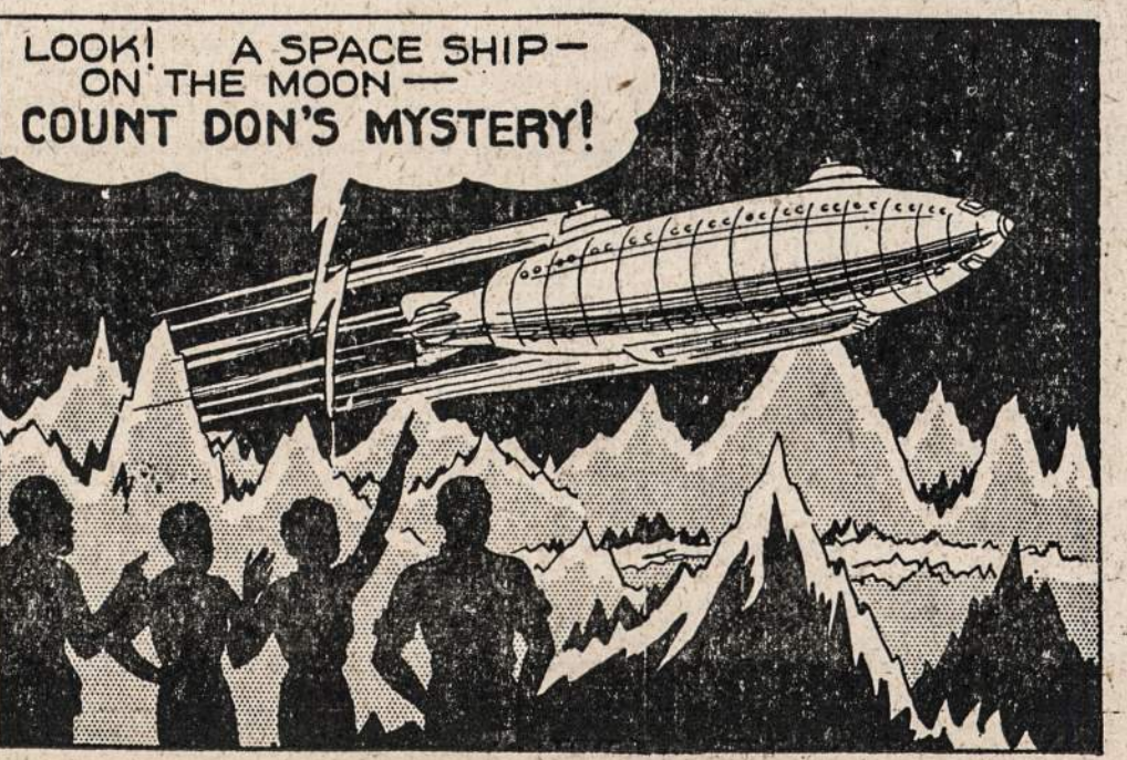
LOOK! A SPACE SHIP — ON THE MOON — COUNT DON'S MYSTERY!