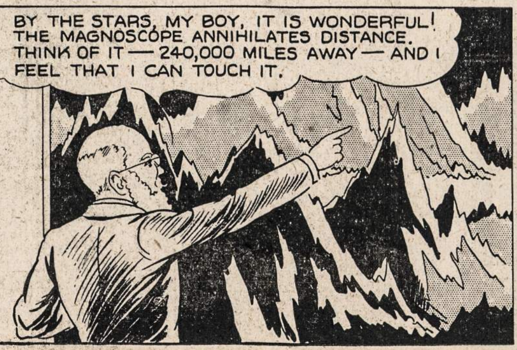
BY THE STARS, MY BOY, IT IS WONDERFUL! THE MAGNOSCOPE ANNIHILATES DISTANCE. THINK OF IT — 24,000 MILES AWAY — AND I FEEL THAT I CAN TOUCH IT.