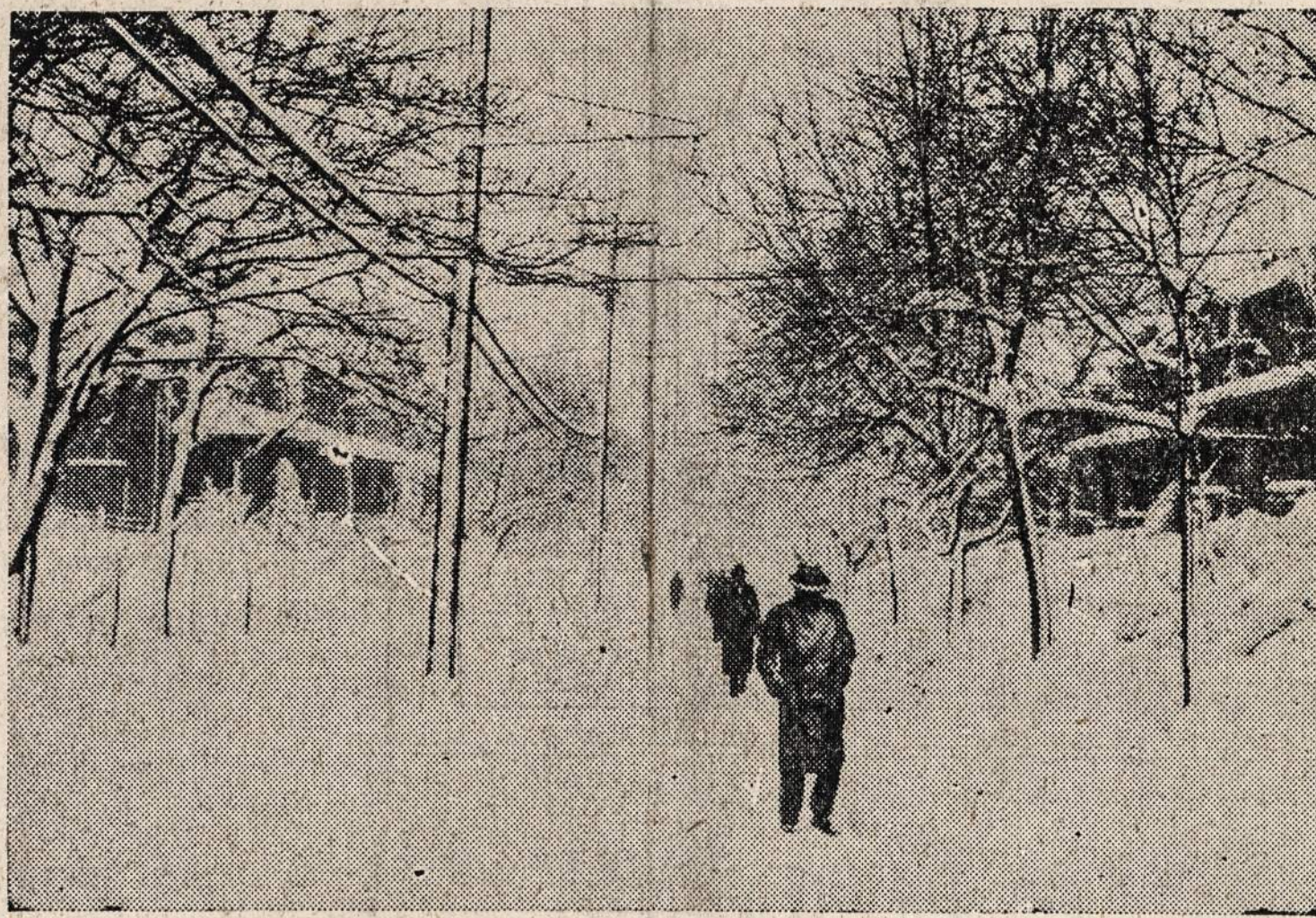
Nepažįstate šio miesto? Tai Pittsburghas. Jis paprastai nuo dumų pajuodęs, bet rekordinis sniego iškritimas jį "nubaltino."