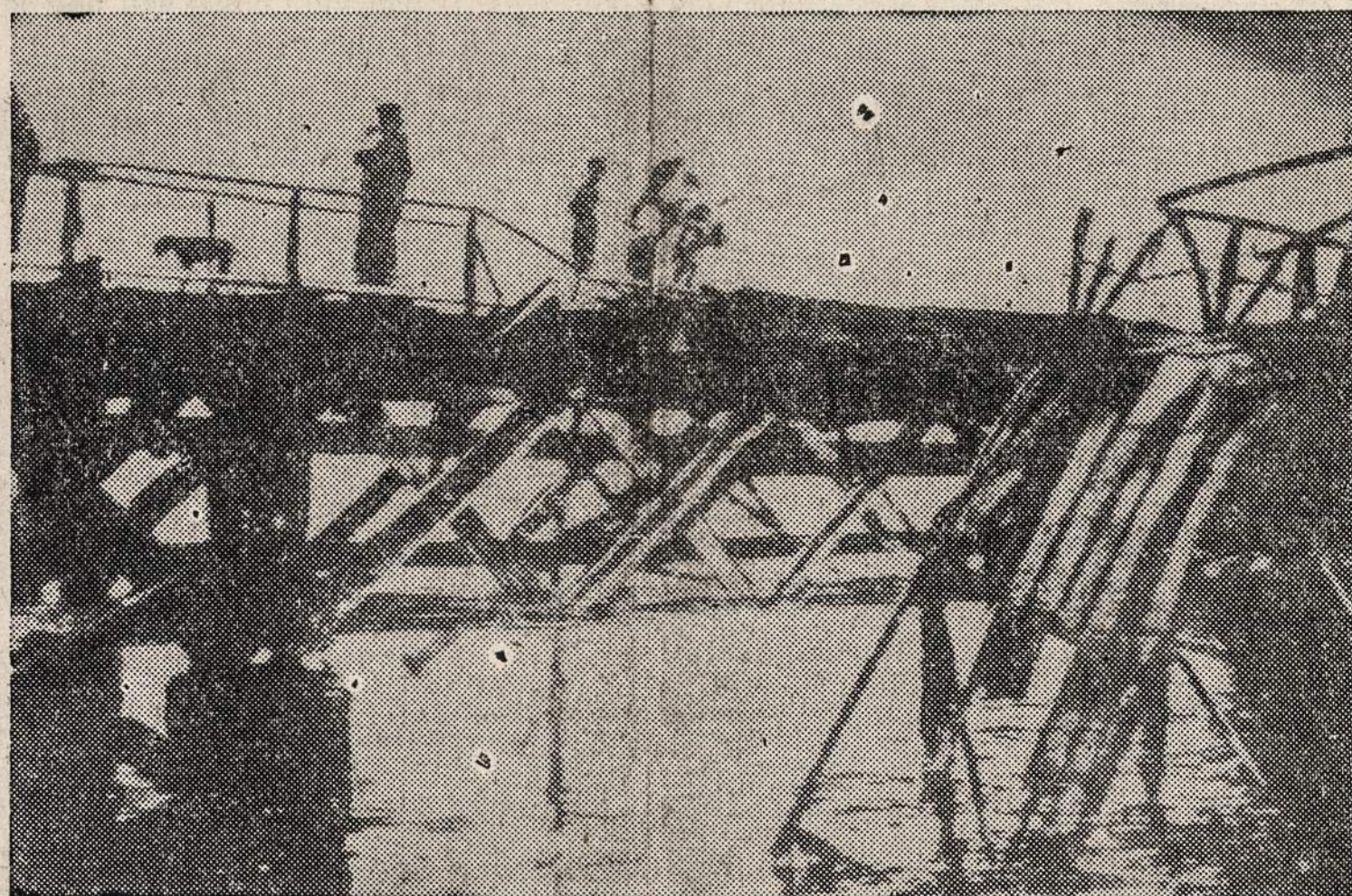
Japonų bombų sugriautas tiltas Darwin mieste, Australijoje. Paveikslas siųstas per radiją iš Darwin į Londoną, o iš ten į New Yorką.