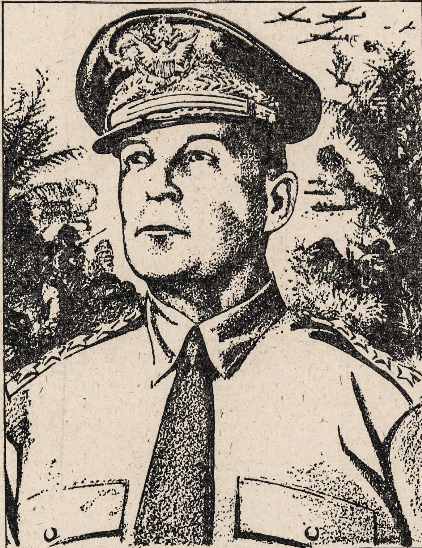
GENEROLAS DOUGLAS MacARTHUR

Velykų švenčių proga raginu visus lietuvius pirkti U. S. Apsigynimo Bondsus ir Stampas, kad užtik- rinus karo laimėjimą ir laisvę