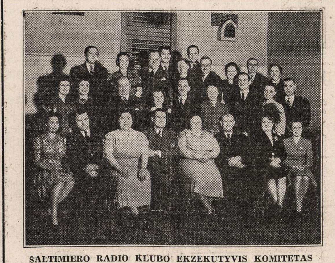
SALTIMIERO RADIO KLUBO EKZEKUTYVIS KOMITETAS