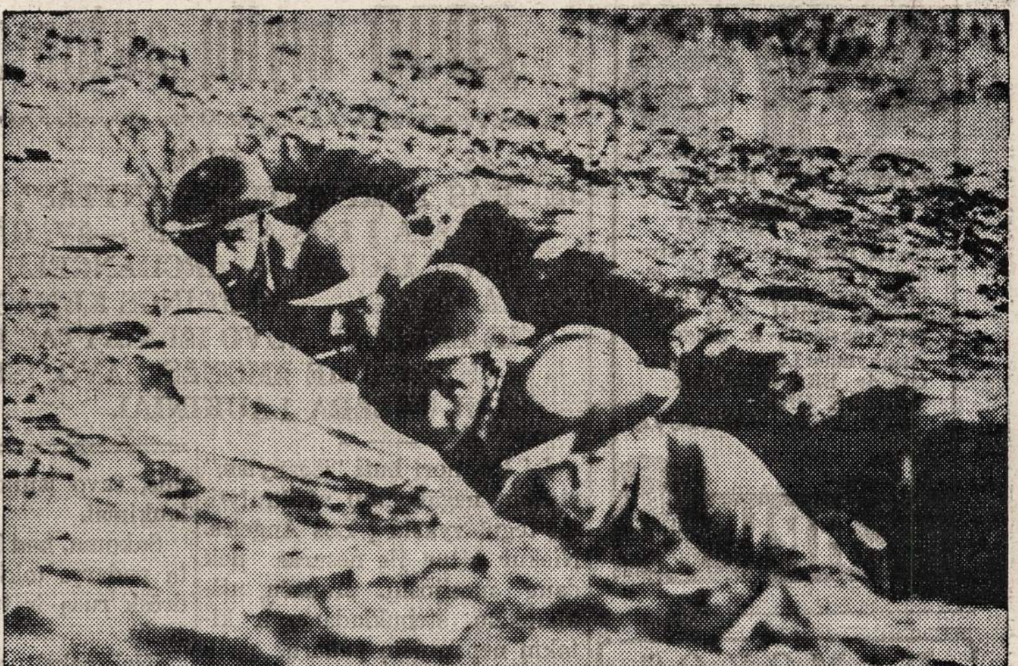
Štai kokiuose "lapės urvuose" amerikiečiai slėpėsi Bataan pusiasaly kovodami su japonais. Matosi keturi kariai, kurių laipsniai yra (iš kairės dešinėn): kapitonas, seržantas, leitenantas, ir korporalas.