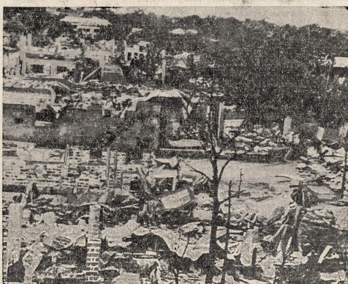
Šiomis dienomis J. V. karo departamentas spūdai perdavė visą eilę fotografijų nuimtų Bataan pusiasaly episkosios kovos metu. Čia matome vieną neįvardintą miestelį, kuris "pasipainiojo" japonams po kojų. Jį priešė aviacija ir kanuočs visiškai sunaikino.

gos mokyklų tarybos prezidentas Cahy pareiškė, kad ateity mokytojai ir mokytojos instruktujas turės imti nuo mokyklų principalų. Mokytojų unija tam pasipriešino. Unijos atstovas nurodo, kad mokytojai ir mokytojos emė instrukcijas laisvu noru, ir labai gali buti, kad jie atsisakys toliau kooperuoti, jeigu p. Cahy spirsis savo užmanymą vykdyti. Nes, sako unijos atstovas, iki šiol darbas ejo sklandžiai be kišimosi principalų; jis gali eiti taip ir toliau.