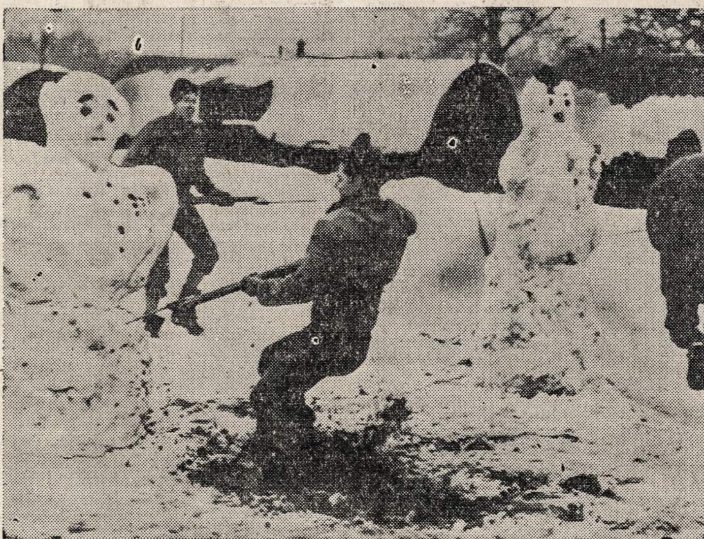
Laukdami iki išmuš valanda kada jie tikrai galės išlyginti sąskaitas su Hitleriu ir Mussoliniu, šie Airijoj apsisotę amerikiečiai kariai lavinasi naudoti durtuvus. Pratyboms jie pasistatę iš sniego nacių fuhrerų ir italų dučę.