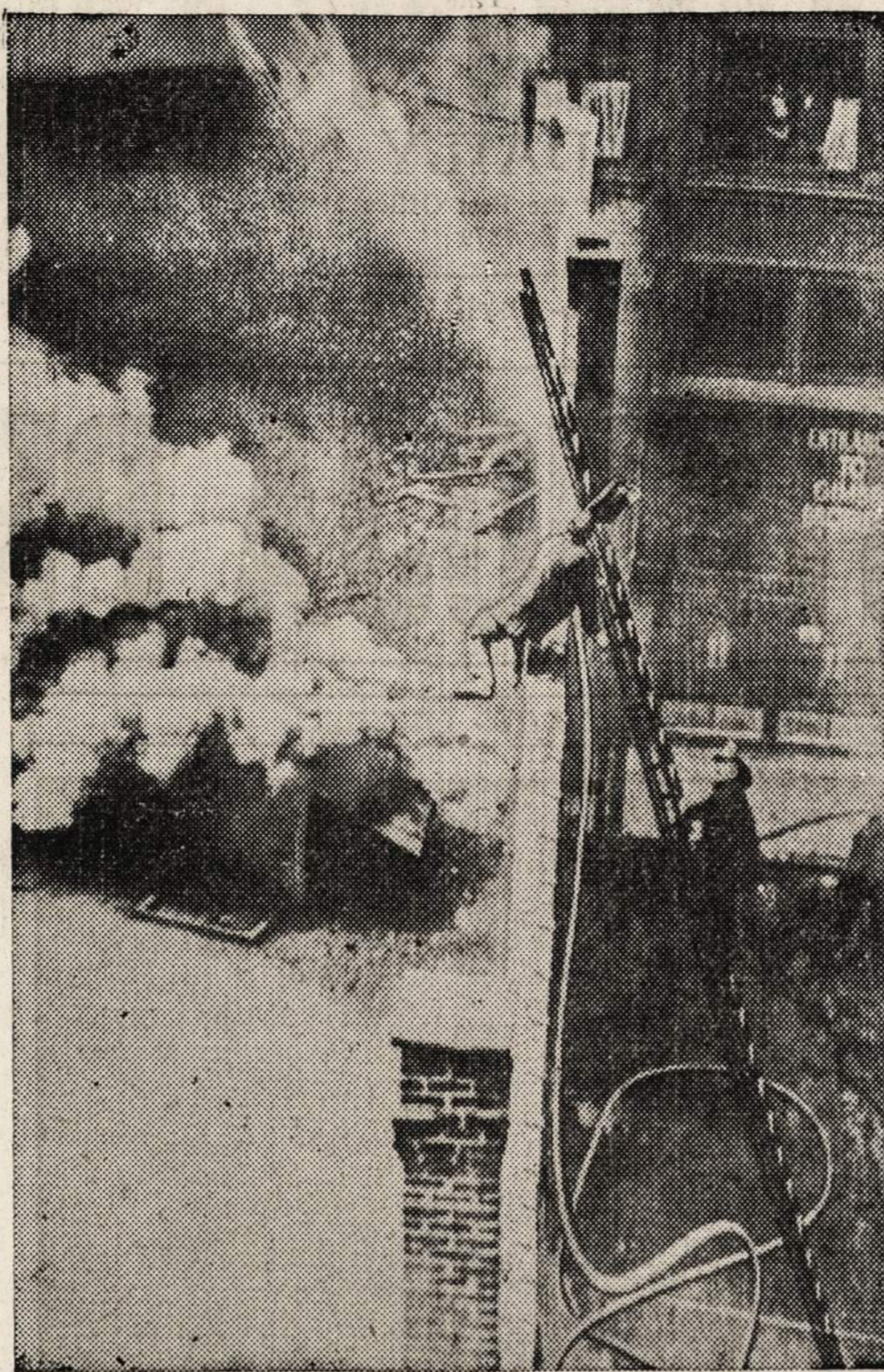
Philadelphijoje ugniagesiams begesinant gaisrą, vienas vyras neteko lygsvaros ant stogo ir nukrito žemėn. Netoliese esančiam fotografui pavyko nuimti šis paveikslas parodantis krintantį ugniagesį "pusiaukelėj". Nelaimė pasibaigė laimingai—ugniagesys išvengė susižeidimo.

sų pakraipų lietuvių išskyrus komunistus, buvo džiaugsmingai sutiktas. Netenka abejoti, kad pastarasis balandžio mėnesį iššęs "N. L." leidinys dar labiau visuomenę patiks, nes savo turiningumu žymiai pralenkia pirmąjį. Tai labai džiugu ir sveikintina, kad "N. Lietuvoj" reikiasi toks žymus progresas! Jau šie du numeriai byloja apie šviesią ir garantuotą "N. L." ateitį. Juk neveltui plaukia gausios prenumeratos! Tik iš Montreale gauta suvirš 60 naujų prenumeratorių.