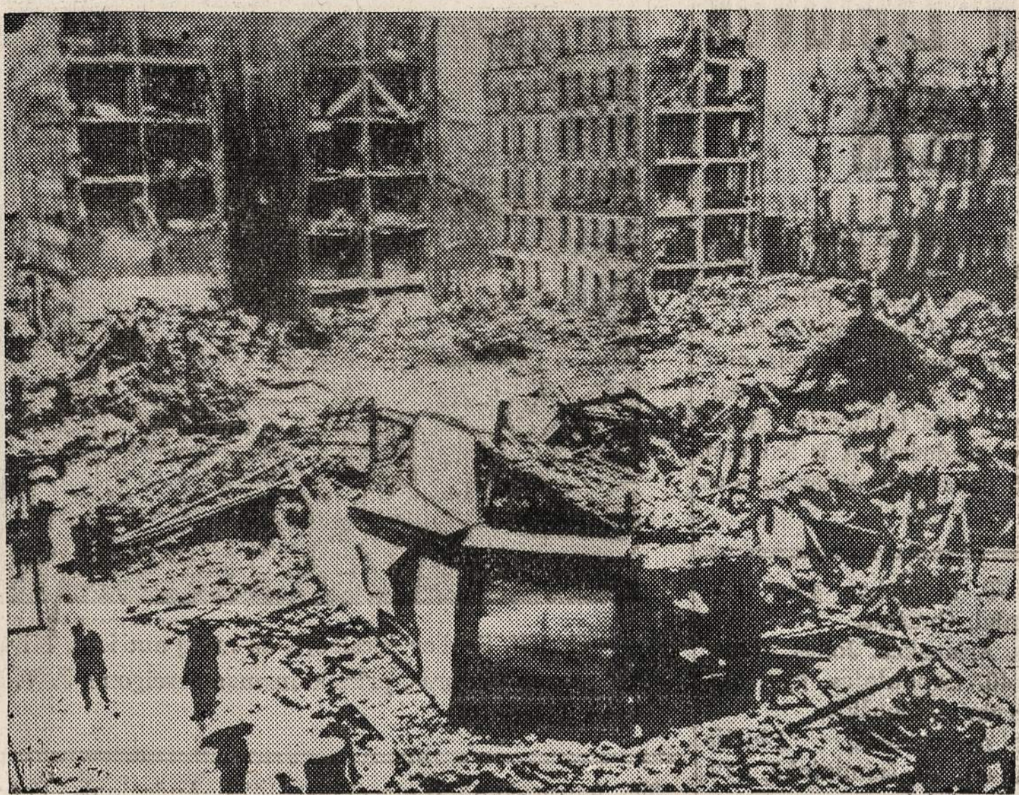
Iš Europos ką tik gauta šie paveiksliai parodą Paryžiuje anglų bombonešių sugriautus pastatus. Anglai dabar vis daugiau ir daugiau bombarduoja Prancuzijoje esančias dirbtuves, kurios dirba nacių karo mašinų naudai.