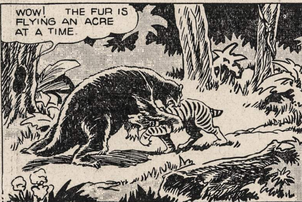
WOW! THE FUR IS FLYING AN ACRE AT A TIME.