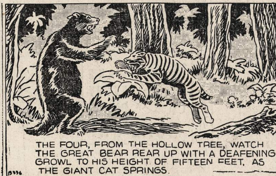
THE FOUR, FROM THE HOLLOW TREE, WATCH THE GREAT BEAR REAR UP WITH A DEAFENING GROWL TO HIS HEIGHT OF FIFTEEN FEET, AS THE GIANT CAT SPRINGS.