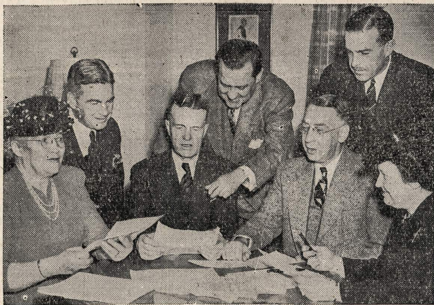
Chicagoje susirinkę republikonų partijos lyderiai svarsto naują partijos programą.