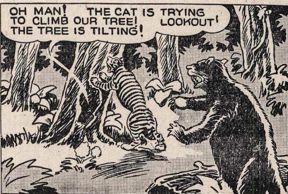
OH MAN! THE CAT IS TRYING TO CLIMB OUR TREE! THE TREE IS TILTING! LOOKOUT!