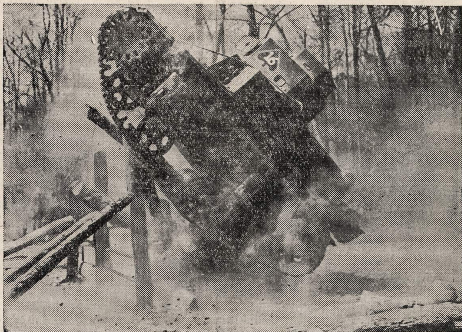
Naujas J. V. vidutinio dydžio tankas demonstruoja, kad jo negali jokios kliūtys sustabdyti.