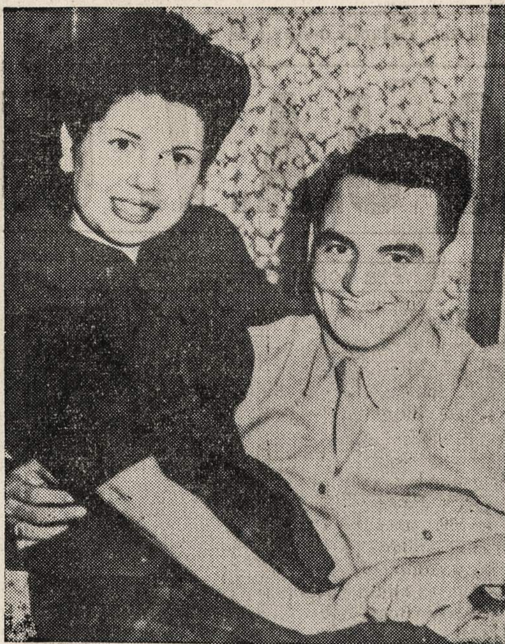
Šis J. V. armijos lakunas Australijoje (jo pavardės cenzoriai nepaduoda) pozuoja su savo jauna australiete žmona. Jiedu apsidė kovo 5 d. dviem savaitėm po pirmojo susitikimo.